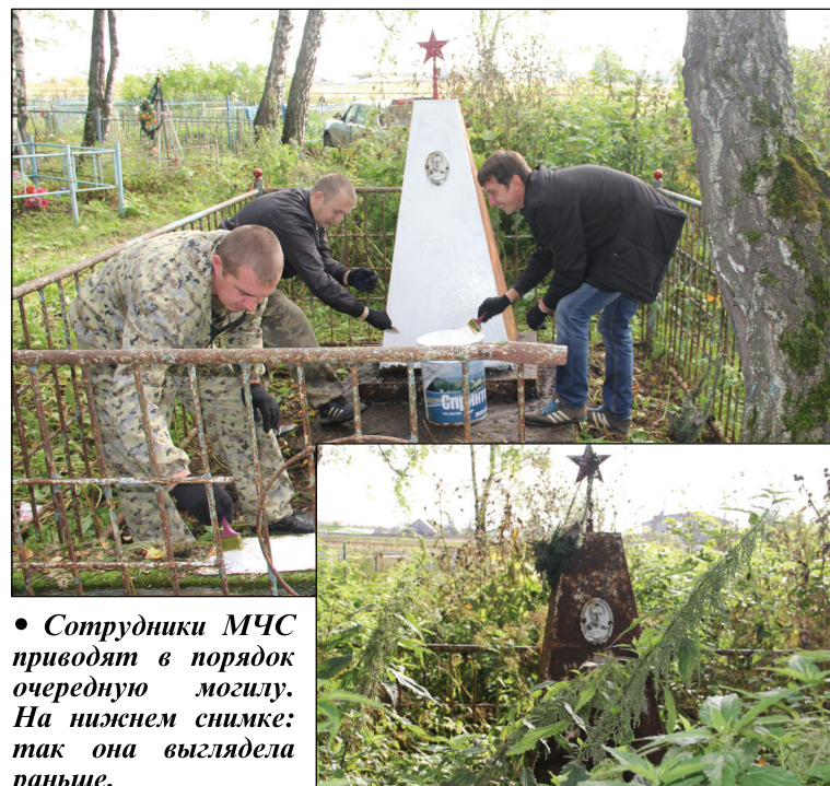
• Сотрудники МЧС приводят в порядок очередную могилу. На нижнем снимке: так она выглядела раньше.

Пришедшие в этот день на субботник аромашевцы свою работу выполнили добросовестно, на кладбище стало чище, но вырвать все сорняки они были не в состоянии. А если следующая весна будет сухой и жаркой, то страшно подумать что может произойти от случайной пошлой сигареты.