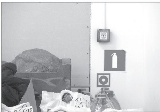
В продовольственной секции «Купеческого ряда» к некоторым аварийным кнопкам не подойти из-за товаров