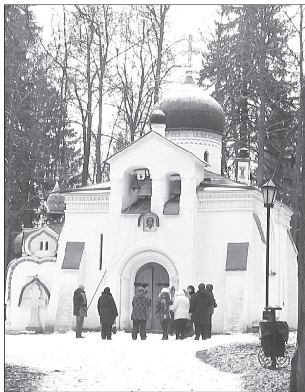
Церковь в Абрамцево. Здесь упокоился С. И. Мамонтов

В столицу Урала царскую семью доставили 30 апреля 1918 года и поместили в «дом особого назначения» - особняк инженера Н. П. Ипатьева, где в ночь с 16 на 17 июля без суда и следствия её расстреляли.