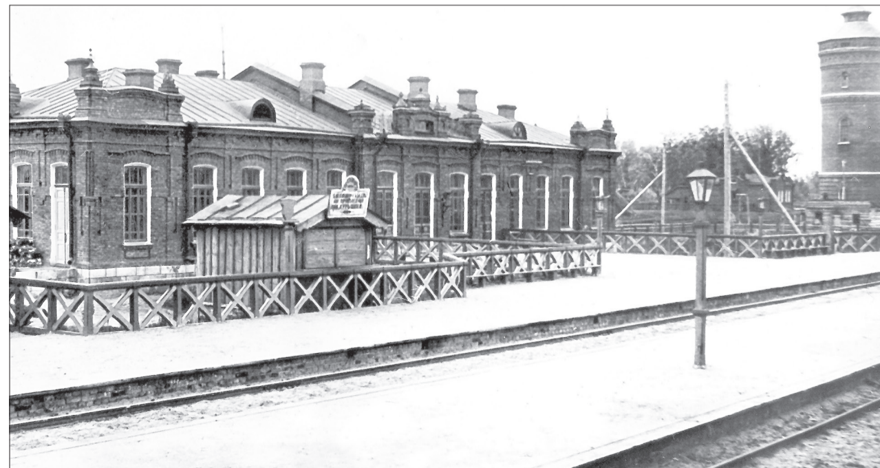
Станция Ялуторовск. Такой её увидела царская семья в 1918 г.