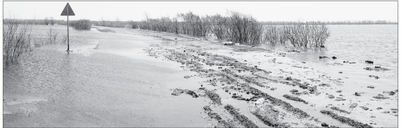
В 2016 году преградой на пути к Кривоульской были затопленные мост и дорога от Хохлово

Вниманию безработных граждан и работодателей! 11 апреля, с 9-00 до 11-00 , центр занятости населения города Ялуторовска и Ялуторовского района проводит ярмарку рабочих мест для безработных граждан, испытывающих трудности в поиске работы (граждане с инвалидностью; граждане предпенсионного возраста - за два года до наступления возраста, дающего право на страховую пенсию по старости, в том числе назначаемую досрочно); одинокие и многодетные родители, воспитывающие несовершеннолетних детей, детей-инвалидов). Адрес проведения ярмарки: г. Ялуторовск, ул. Карла Либкнехта, 33/1.