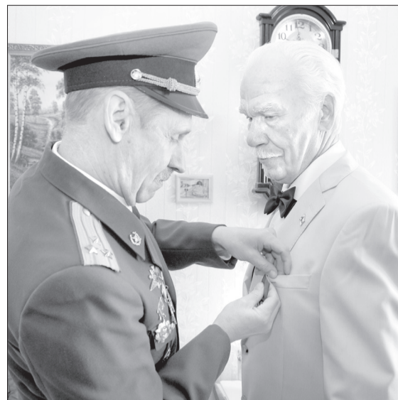
Медаль за защиту рубежей государства засияла на груди ветерана