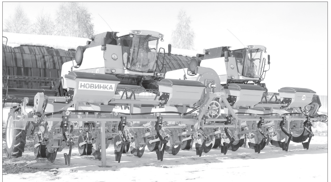
В этом году в «Приозёрном» на «кукурузу» выйдет новая сеялка «Vespa-8»