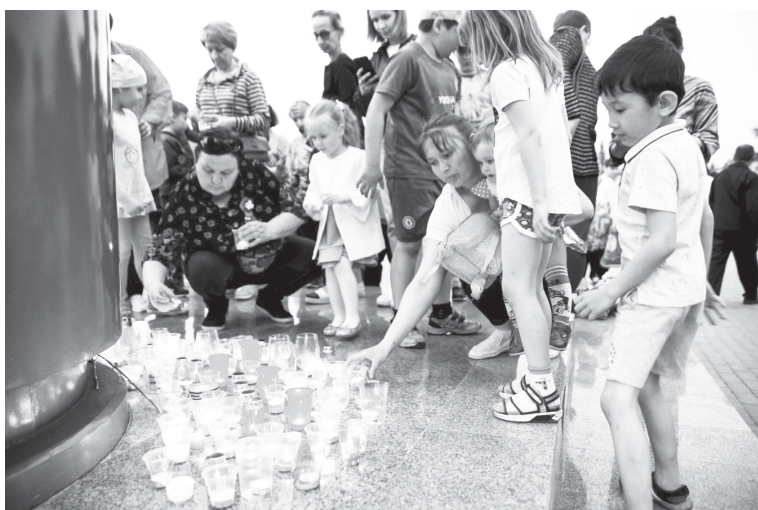
Акции «Свеча памяти» в райцентре.