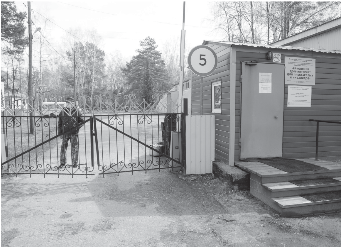
На территории дома-интерната – режим полной изоляции

Масштабное распространение коронавирусной инфекции в Тюменской области привело к изменениям в работе всех жизненно важных сфер деятельности. Одной из них стала социальная политика: с 20 апреля, согласно приказу регионального департамента соцразвития, в организациях отрасли введен режим полной изоляции. Данная мера принята с целью недопущения распространения коронавируса в стационарных учреждениях социальной сферы.