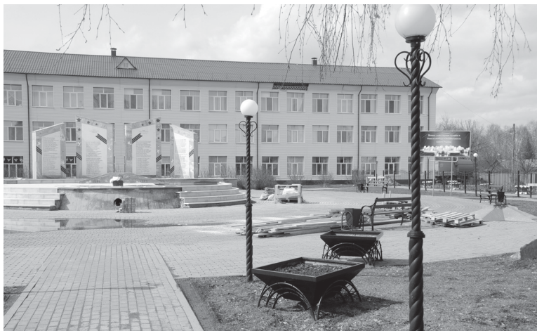
Работы по капремонту монумента павшим в Великую Отечественную войну в Ярково завершатся ко Дню Победы

В память о каждом из них на малой родине установленыobelisks. В год 75-летия Победы эти стелы должны выглядеть особенно торжественно. В эти дни продолжается капитальный ремонт монументов павшим героям в Ярково, Усалке, Дубровном, Плеханово, Новоалександровке и Новокаишкулье. Рядом с остальными памятниками проводится благоустройство. К 9 мая все работы будут завершены.