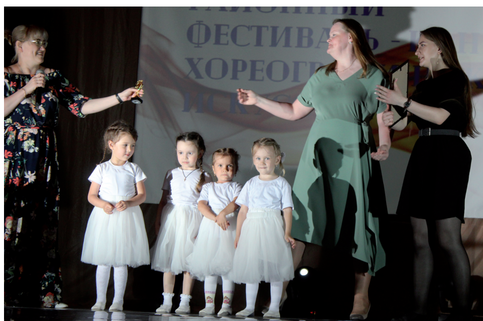
Танцевальный коллектив «Потешки» получил награду за танец «Зимняя сказка».