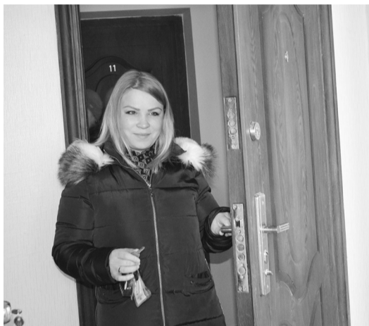
Счастливая обладательница новой квартиры.