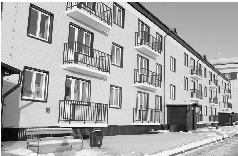
Современный дом вырос на месте пустыря