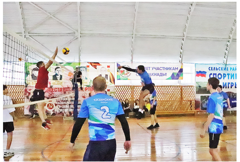
Старшеклассники красиво и зрелищно играли в волейбол