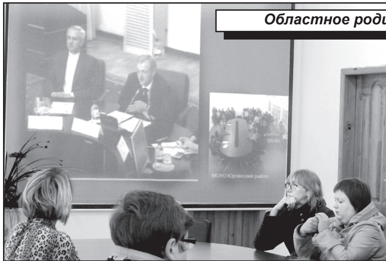
Областное родительское собрание

Такие собрания, организуемые в режиме онлайн, в регионе становятся нормой. Их популярность объясняется просто: это открытая площадка для обсуждения актуальных вопросов в системе образования, способствующая продуктивному взаимодействию всех участников процесса обучения и воспитания. В этот раз, 14