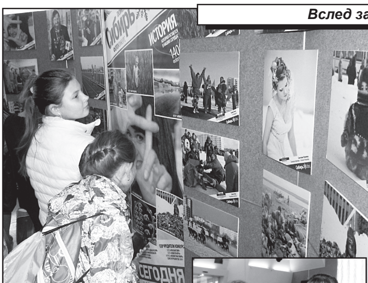
Работы выставки привлекают внимание