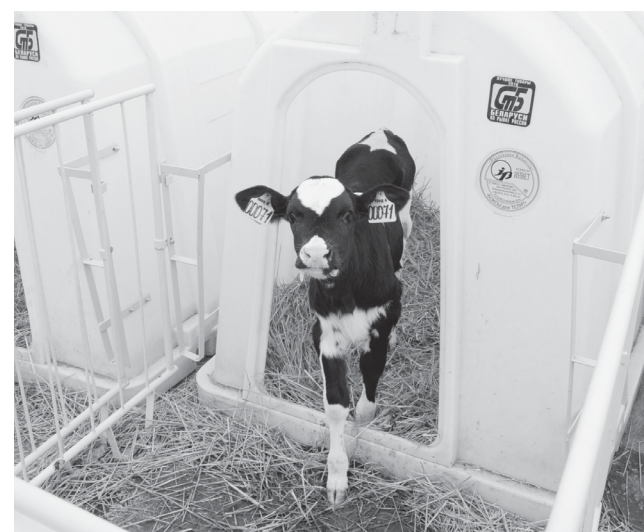
На смену выбракованным животным рано или поздно придет пополнение

- Как вы считаете, отразится ли данная ситуация на общегодовых показателях?