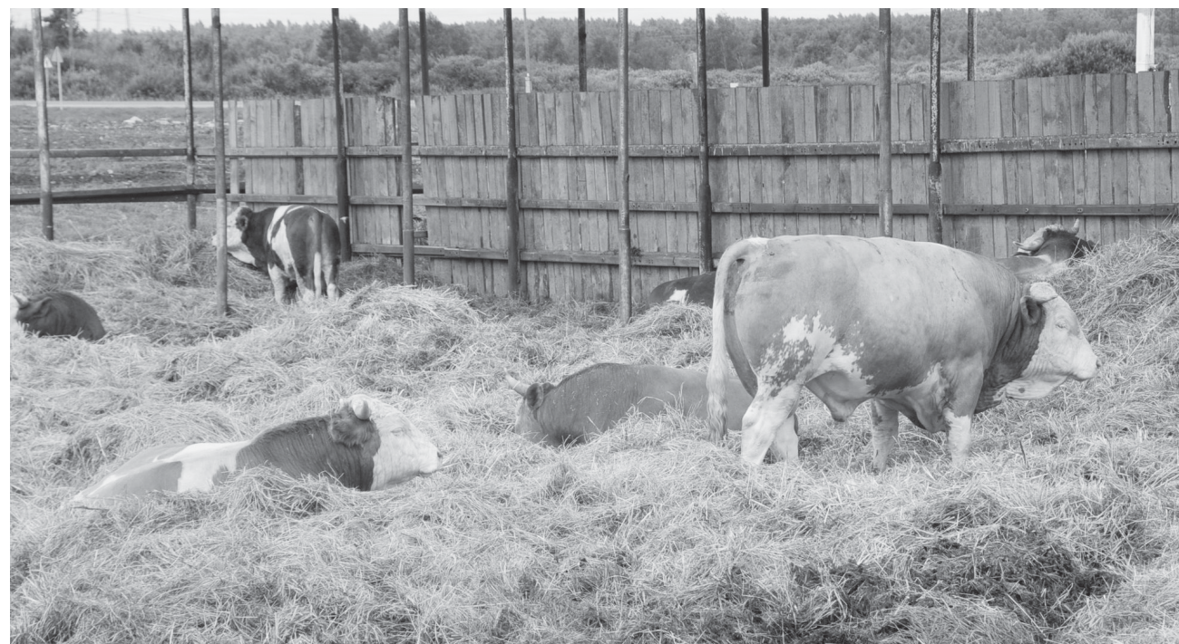
Жара нынешнего лета отразилась, в том числе, и на аппетите животных