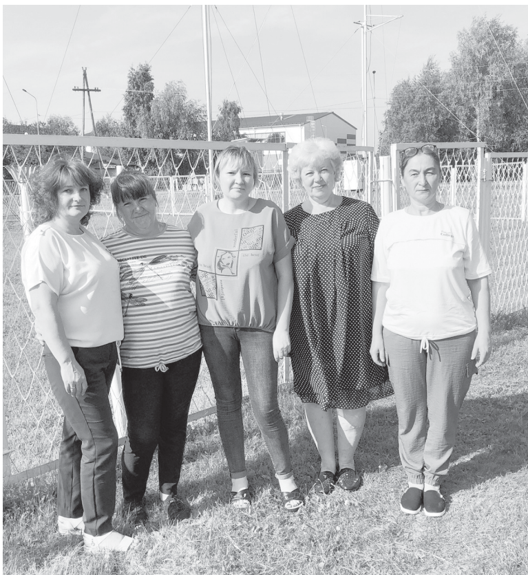
Коллектив работников метеостанции 2021 года

22 августа – 90 лет со дня образования метеорологической станции Ярково