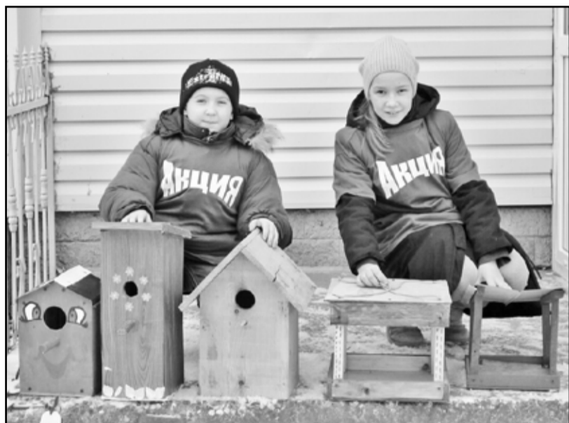
Нужно помочь птицам пережить голодную зиму