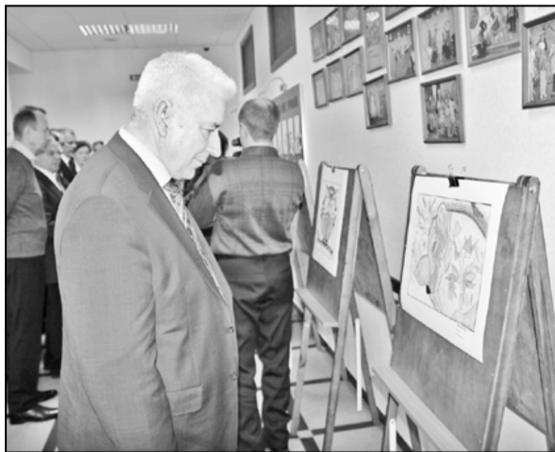
Гости из Тюмени высоко оценили творчество воспитанников Казанской школы искусств