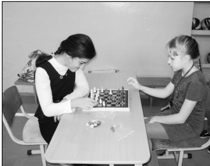
Увлекательная игра – шахматы

Во время осенних каникул для учеников начальных классов Казанской школы прошли традиционные соревнования по шашкам и шахматам, а также по пионерболу между командами классов.