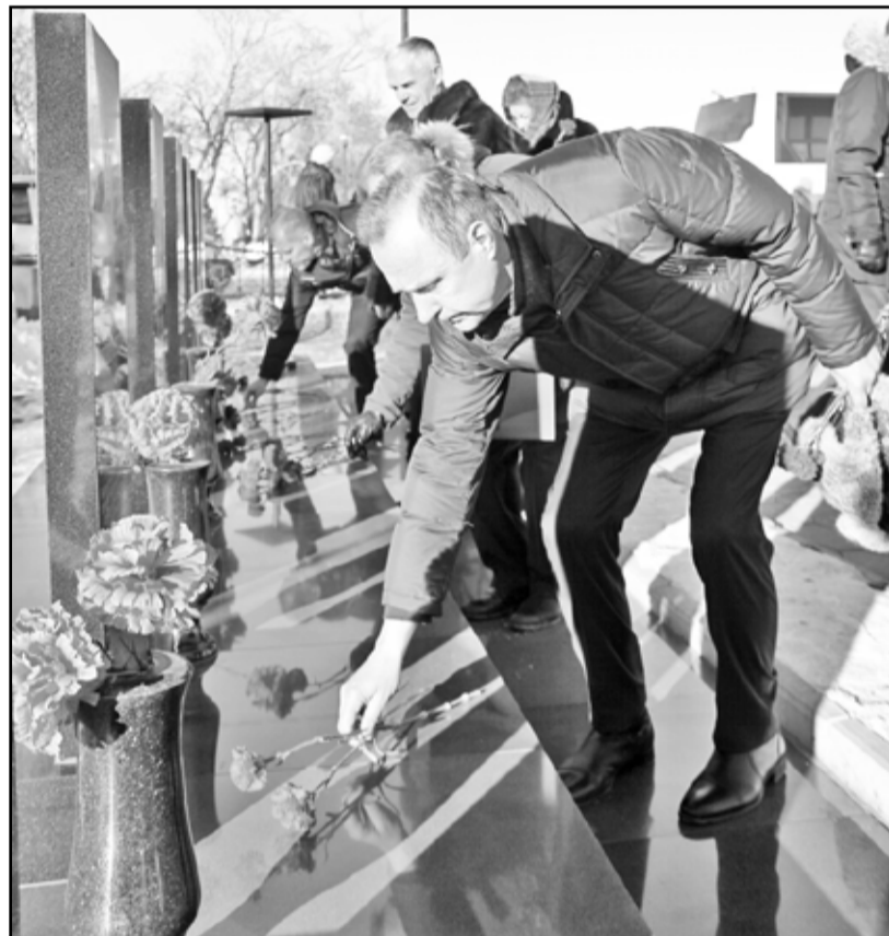
Возложение цветов к памятникам героям – не только официальный ритуал, но и нечто большее