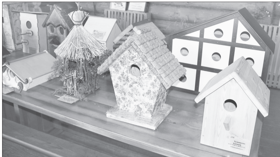
Пригодные для проживания птиц скворечники развешат в парках, на территориях школ и детских садов. Какие-то, возможно, приживутся в остроге

Тем не менее ялutorовчанам важнее было участие. Активно проявили творчество вос-