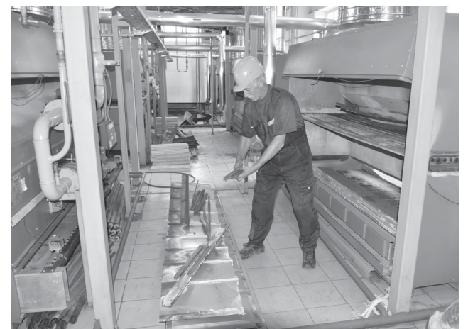
В этом году в районе проведен обширный ремонт теплосетей