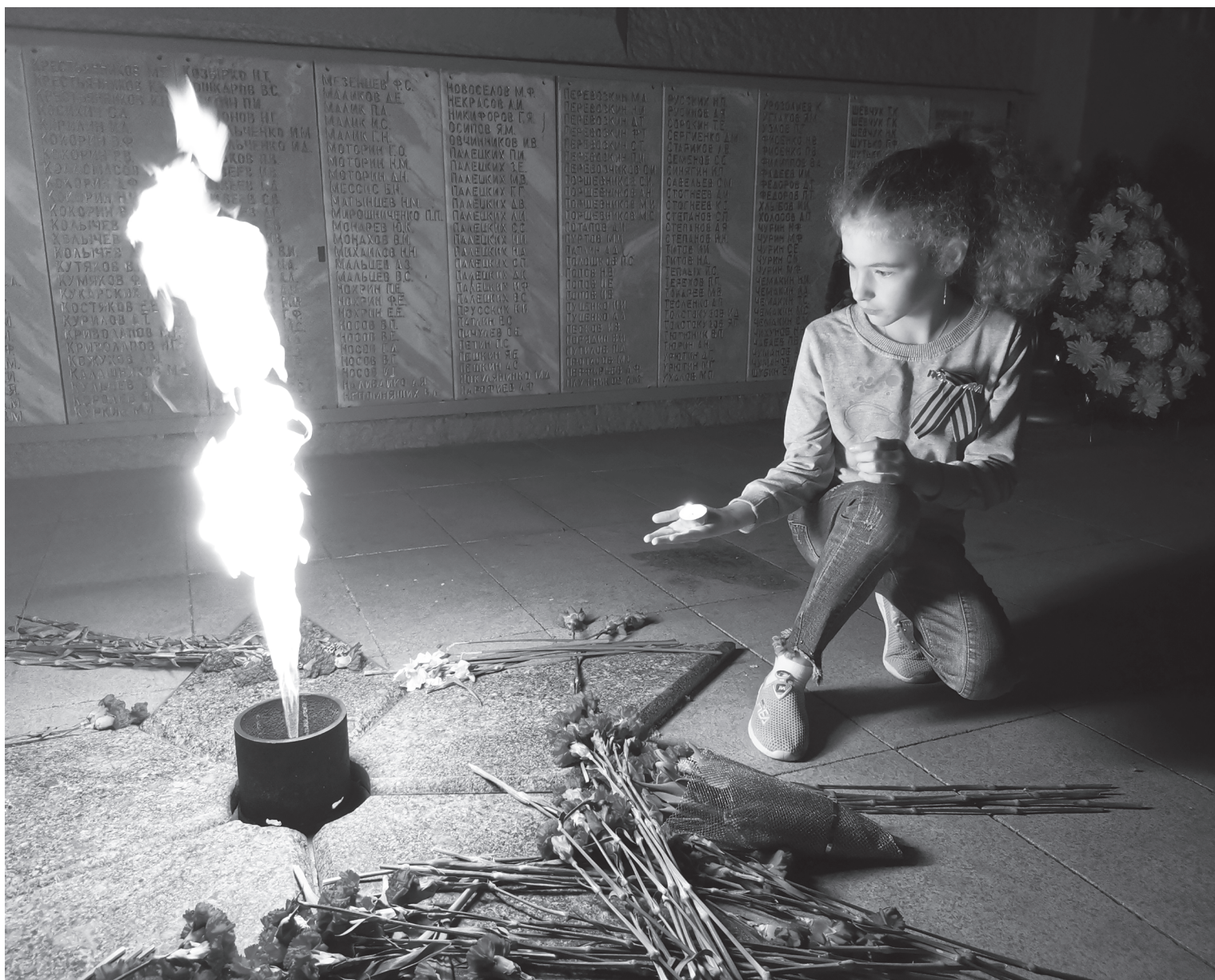
«Свеча Памяти» – акция, в которой юргинцы ежегодно принимают активное участие