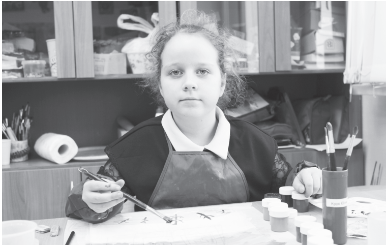
Дети вернулись к любимым занятиям

Татьяна АГАПИТОВА