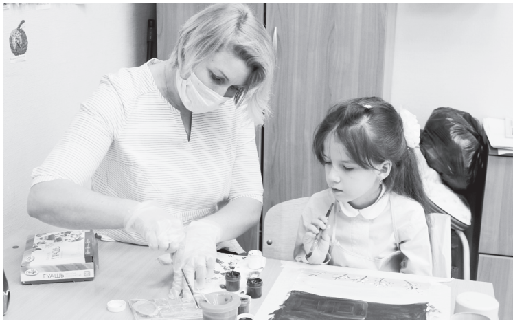
Одно из условий деятельности – соблюдение санитарно-эпидемиологических требований

– Все сотрудники проходят утренний «фильтр» с проведением термометрии, на входе обрабатывают руки кожными антисептиками. Перед занятиями и у детей, и у взрослых есть возможность обработать руки дезинфицирующими средствами – у каждого педагога есть анти-