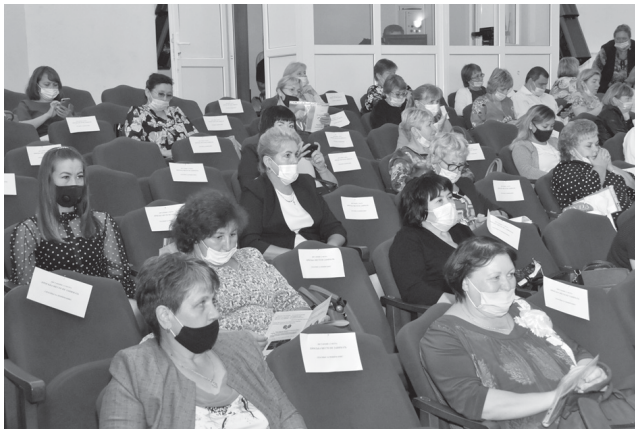
Августовский форум традиционно собирает на своих «полях» педагогическую общественность района

Другие задачи в этой сфере, намеченные районной властью на перспективу, – капитальные ремонты общеобразовательных учреждений в Дубровном и Покровском. Кроме того, ждут строительства новых зданий школ ученики и педагоги, живущие в Большом Краснояре и Старом Каишуле. «Только в условиях постоянного диалога органов власти, педагогической и родительской обществен-