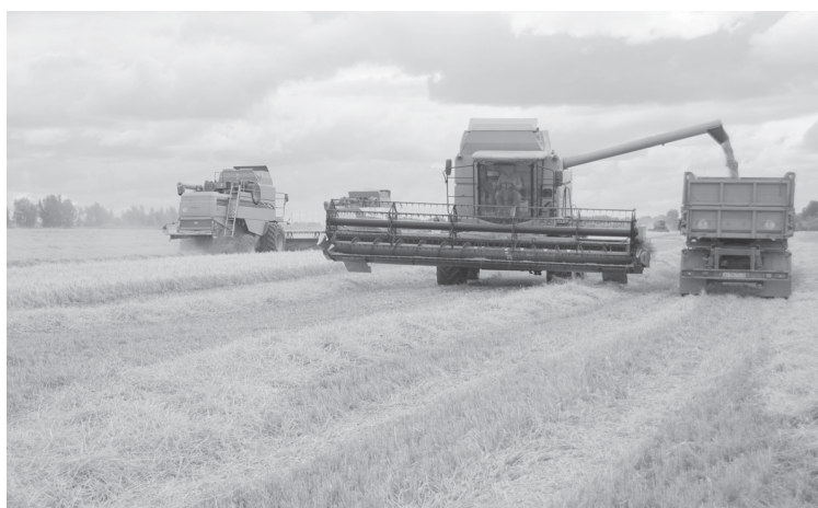
На части посевов зерноуборочные комбайны в этом году работать не будут