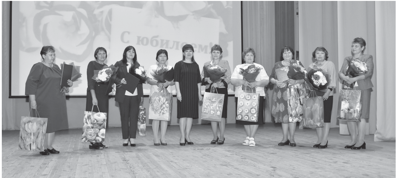
Награды в этот день получили и педагоги-юбиляры

ности мы сможем решить все стоящие перед нами задачи», – отметил, завершая свое выступление, глава муниципалитета.