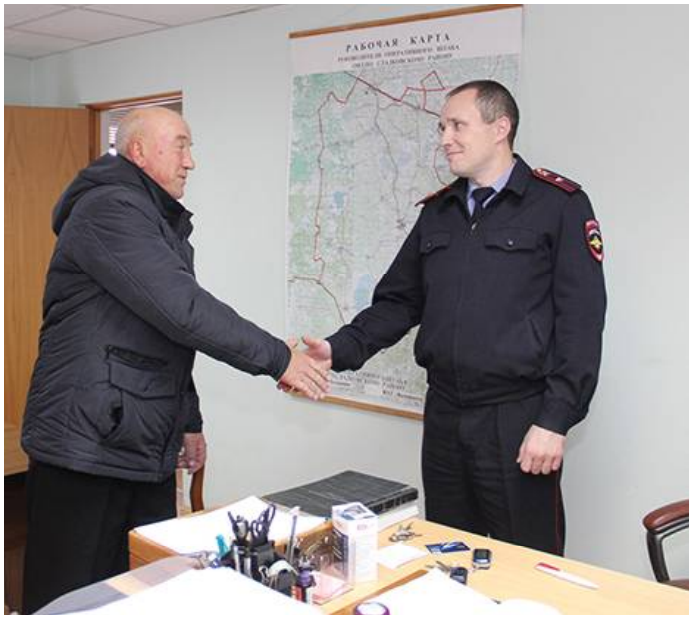
* Встреча двух поколений

◆ 10 НОЯБРЯ - ДЕНЬ СОТРУДНИКА ОРГАНОВ ВНУТРЕННИХ ДЕЛ