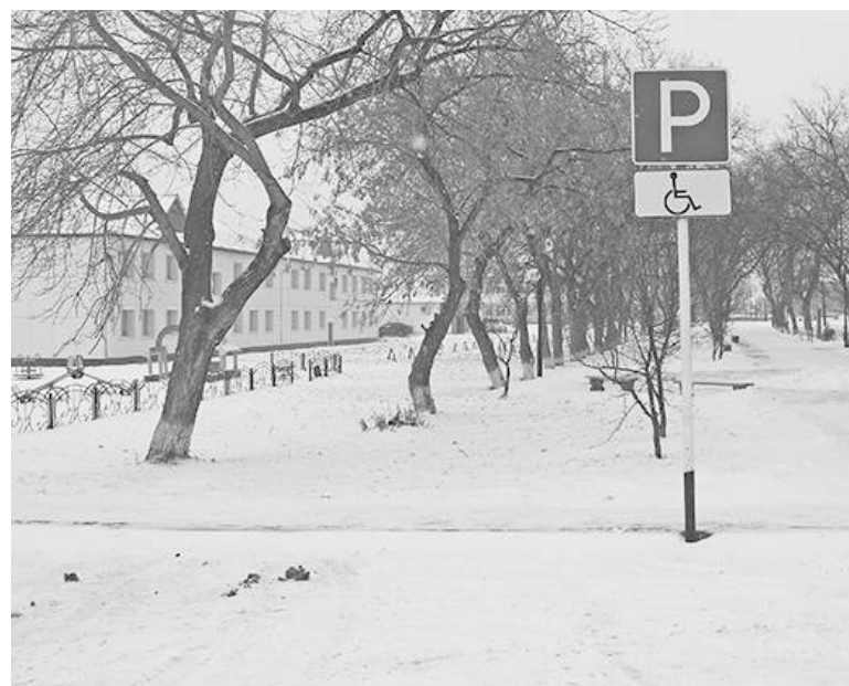
* Места для стоянки.