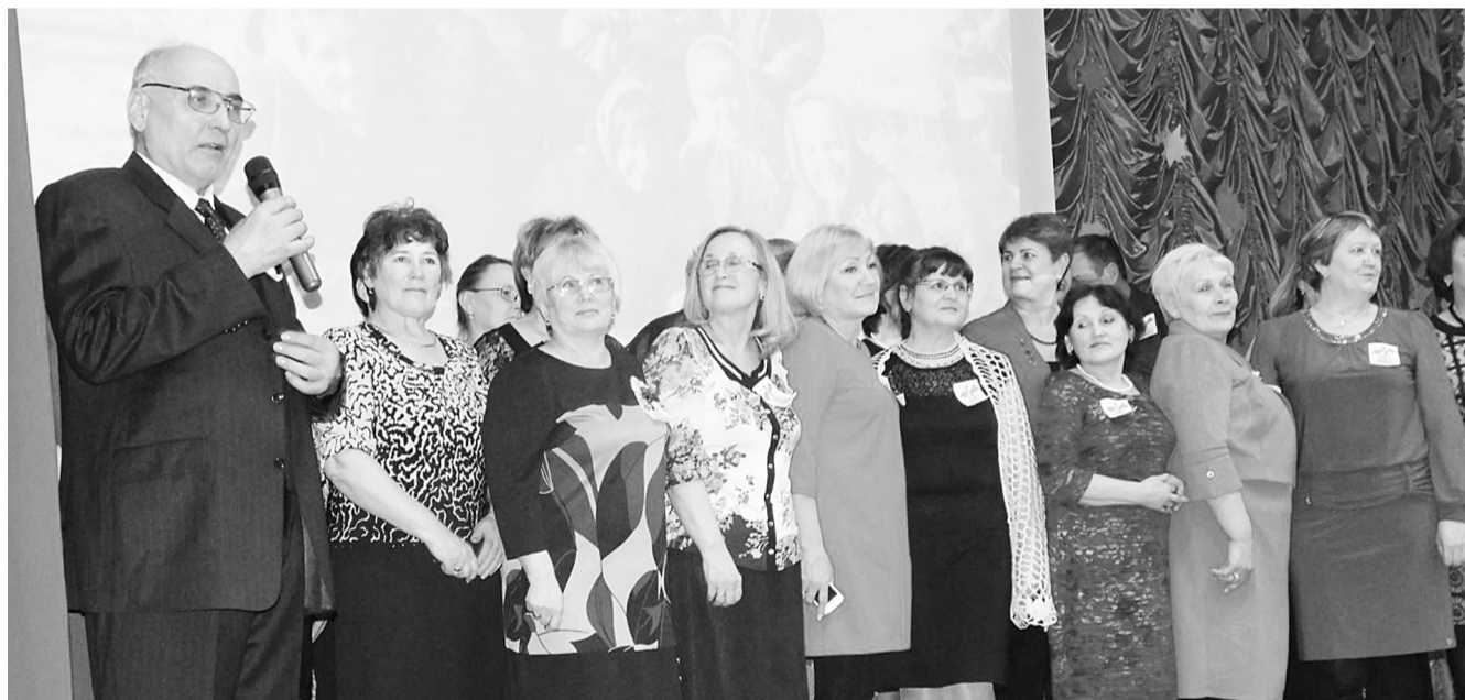
Выпуск 1977 года.

На любой дороге, в стороне любой школе ты не скажешь «до свидания», школа не прощается с тобой... Вот так, перефразированными словами известной песни можно начать рассказ о вечере встречи выпускников, который состоялся в минувшие выходные.