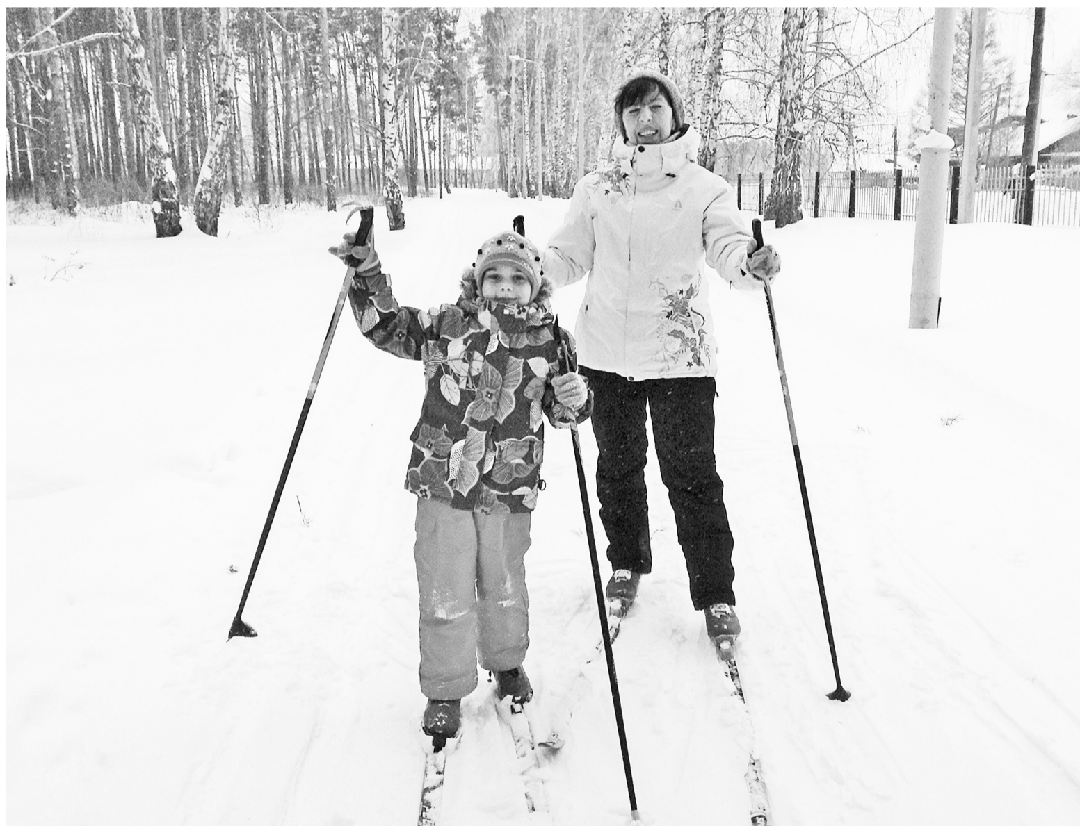
Кружок – другой пробежать для нас обеих не составляет труда, хотя разница в возрасте 55 лет!

ГТО на слуху с 2014 года. 24 марта этого года вышел Указ Президента России за №172 «О Всероссийском физкультурно-спортивном комплексе «Готов к труду и обороне» (ГТО)».