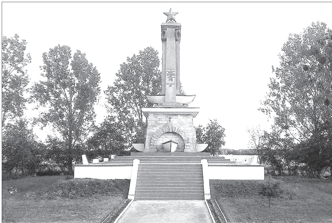
Из-за ветхого состояния чиновники хотели снести памятник советским солдатам, форсировавшим Одер в 1945 г. Чтобы этого не допустить, в 2017 году монумент отреставрировали активисты польского общественного движения «Курск»