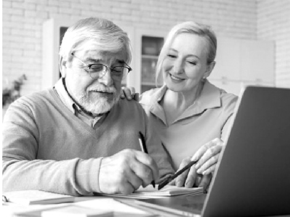
Более 3,7 тысячи жителей Тюменской области обратились в региональное Отделение СФР за справкой о статусе предпенсионера