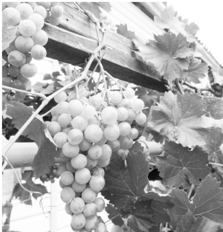
Виноград, выращенный Лидией Вениаминовной.