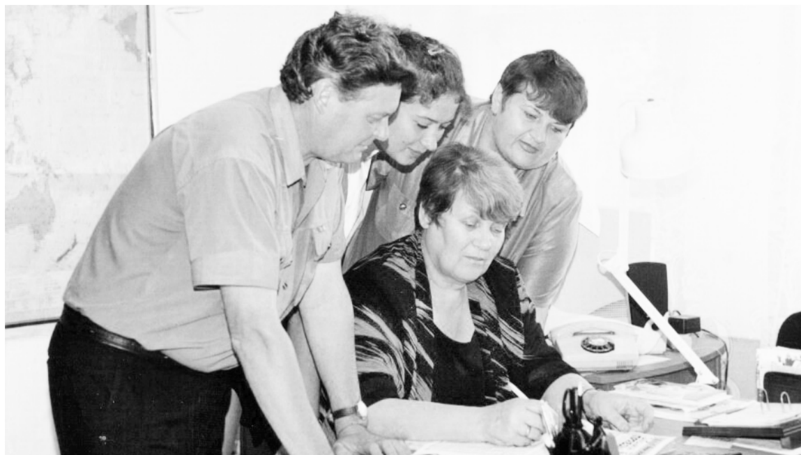
На фото запечатлён один из многих прекрасных творческих моментов.

Окончание. Начало в № 26 от 27 марта, в № 28 от 3 апреля и № 30 от 10 апреля.