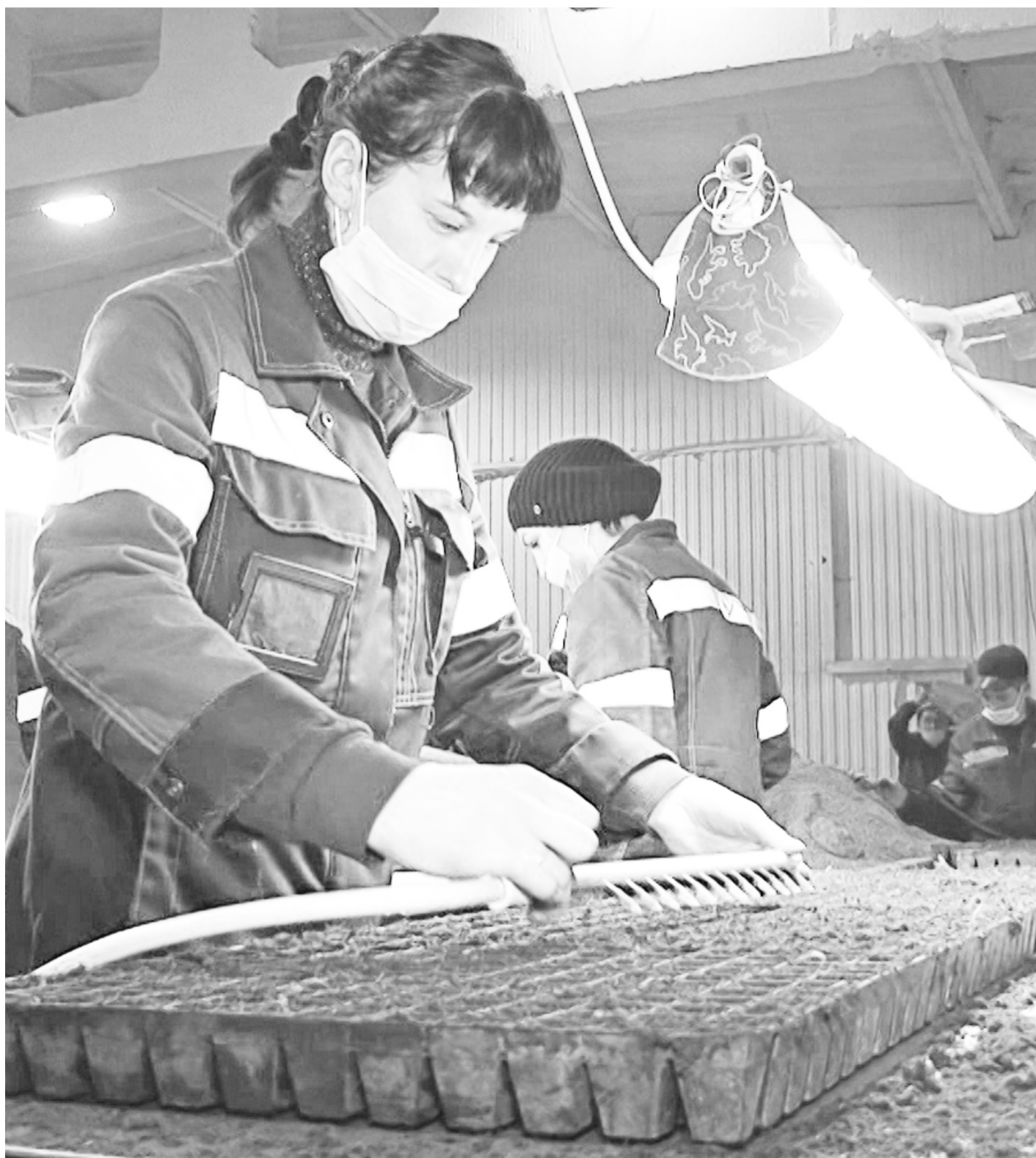
Для ускорения сева работники используют вакуумные машинки.