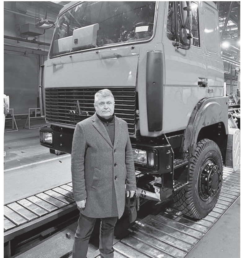
На сборочном конвейере Минского автомобильного завода

Только в конструкторском бюро того же «Амкодора» работает около восьмисот инженеров. А руководитель предприятия говорит: «Дайте нам ваши предложения, и через полгода вы получите именно ту машину, которую хотели бы». Таким об-