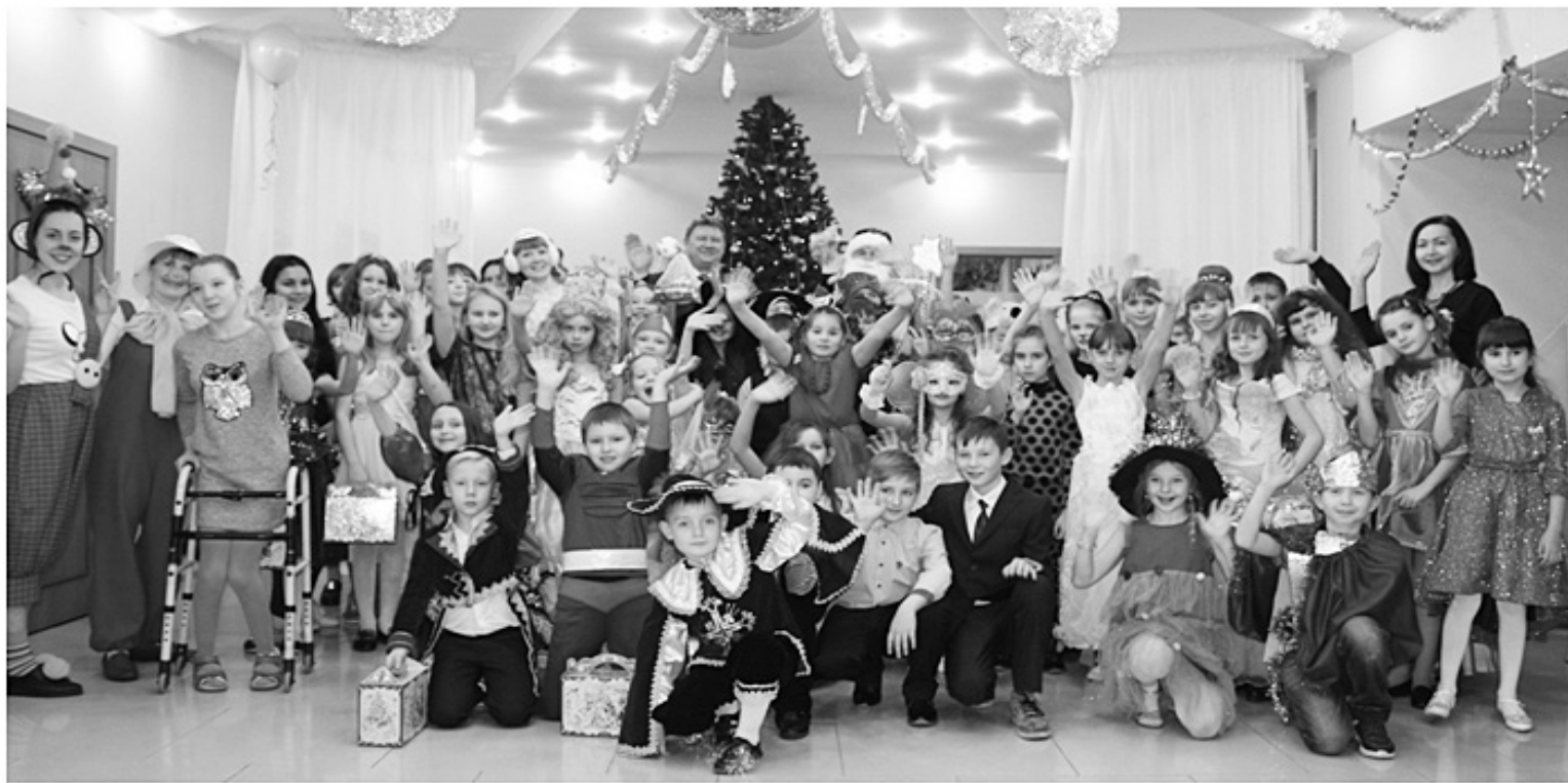
Новогодняя ёлка главы района всем подарила праздничное настроение

У молодого педагога – грандиозные планы, пожелаем ей успешного их осуществления!