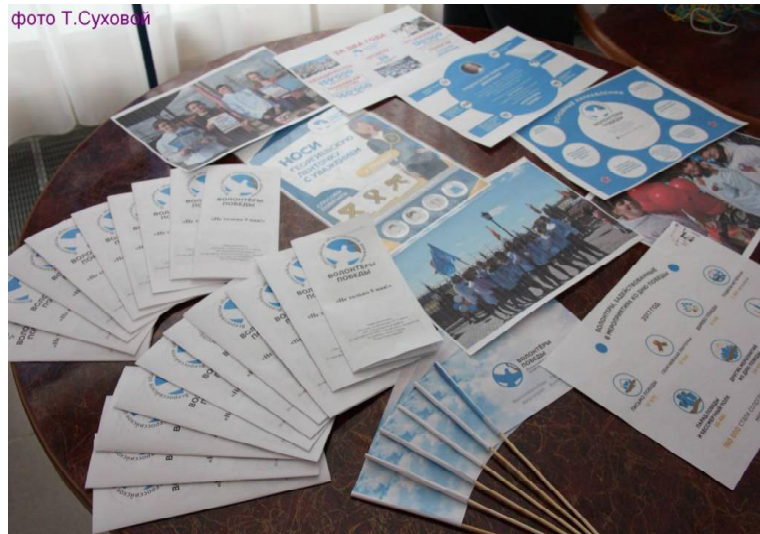
» Проект «Волонтеры Победы»