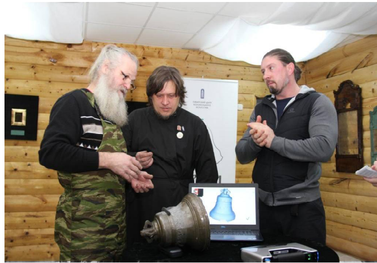
» Специалисты Сибирского центра колокольного искусства — в музее им. А. В. Давыдова

Члены экспедиции приятно удивили своей открытостью, доброжелательностью и неподдельным интересом к истории нашего края. Вошли в