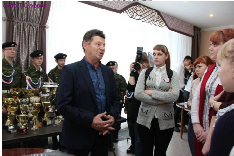
» Группа добровольной подготовки к военной службе «Ратибор» из Поддубровного