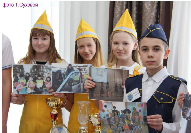
» ЮИДовцы – гордое звание!