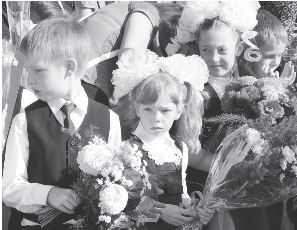
1410 учеников пришли 1 сентября в школу №4, из них 197 - первоклассники