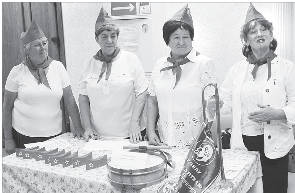
«Пионерки» из Заводопетровского устроили гостям праздника путешествие в юность