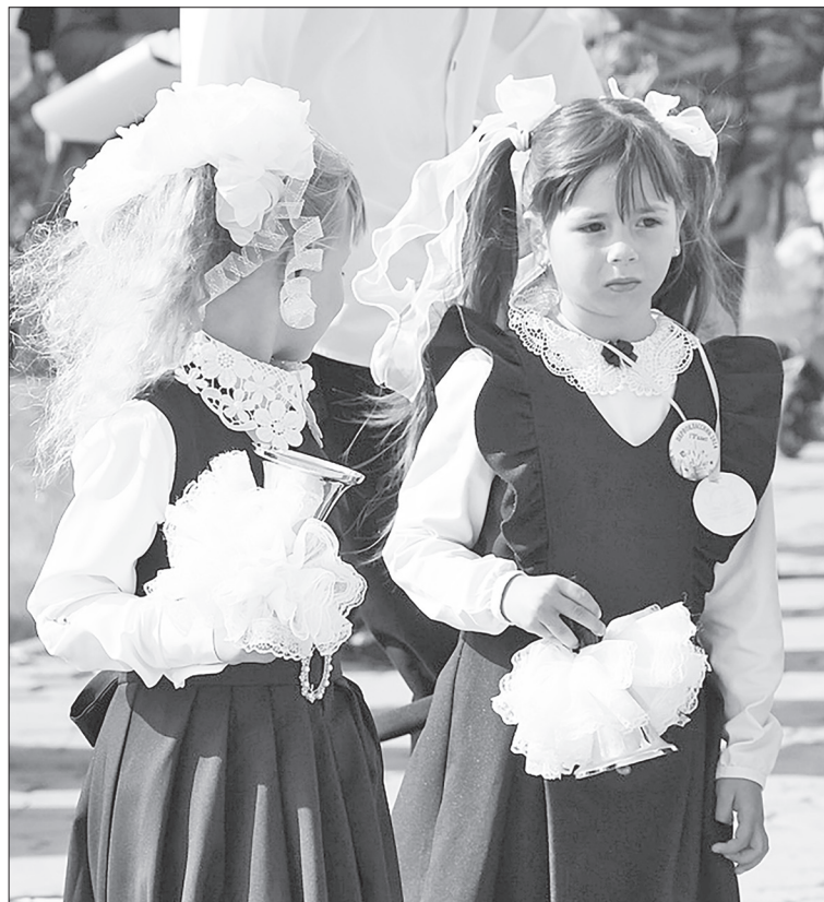
В скором времени школьный звонок в своём первоизданном виде сохранится лишь как традиционный элемент, знаменующий начало и конец учебного года на праздничных линейках.

Идея направлена на воспитание гармонично развитой личности, а также знакомство ребят с шедеврами выдающихся композиторов нашей страны. Организаторы проекта напоминают, что предметно-пространственная среда, созданная в каждом образовательном учреждении, существенно влияет на формирование интеллектуальных и духовно-нравственных качеств личности. Нововведение позволит расширить знания школьников о культуре, истории и традициях русского народа, познакомит их