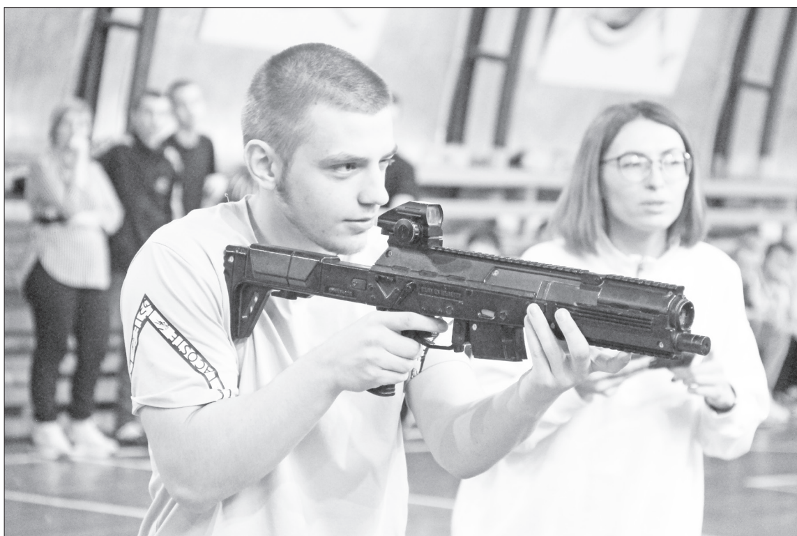
На стрельбах из лазерной винтовки участники соревнования отработали важные навыки.

Таким образом, мы видим, что система подготовки работает, наверняка нижнетавдинцы в скором будущем покажут отличные результаты военной подготовки.