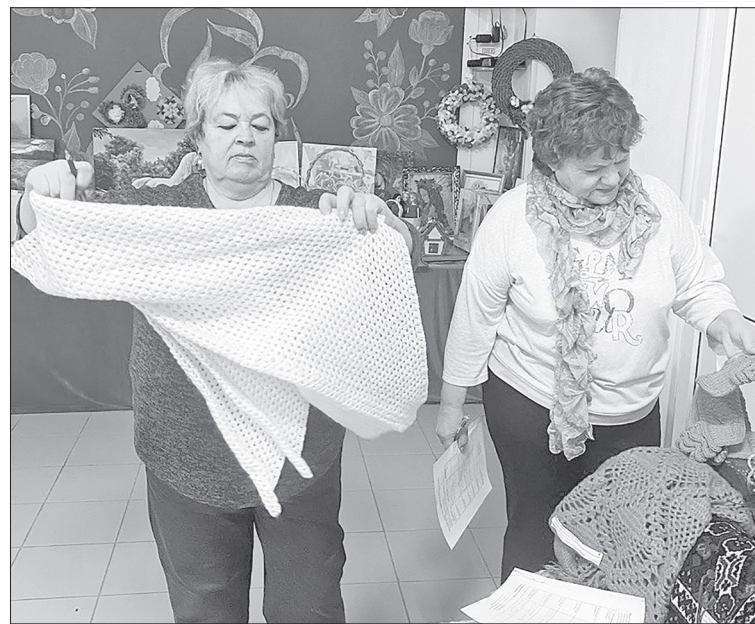
Жюри оценивает творчество мам Нижнетавдинского района.

Свои заслуженные награды мастерицы получают 22 ноября на праздничном мероприятии ко Дню матери.