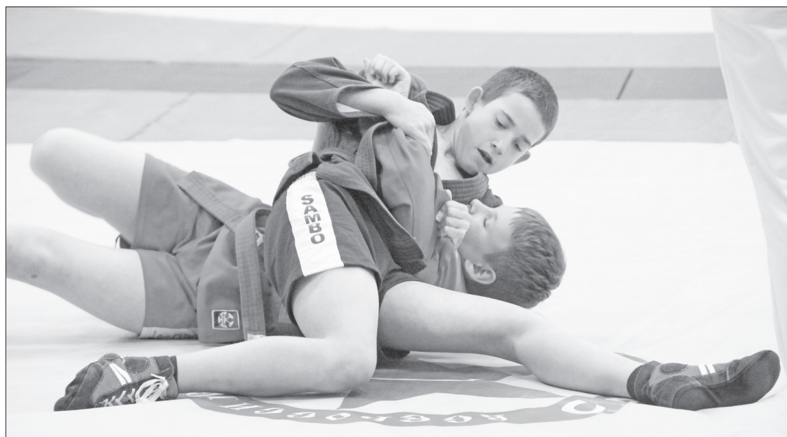
Самбо в школах сегодня осваивают в половине муниципалитетов региона. Философия рукопашного боя – это постоянное развитие, стремление к лучшему и поиск оптимальных решений проблем.

Ну и, конечно, впервые соревнования завершились грандиозным фейерверком, взбодоражившим нижнетавдинцев,