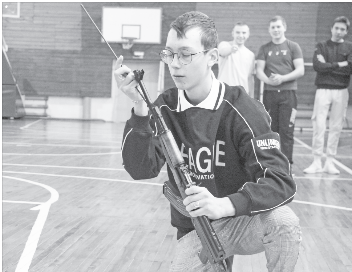
Команда Андрюшинского сельского поселения выполнила задания в числе первых и прошла все этапы достойно.

В школах района набирает обороты начальная военная подготовка