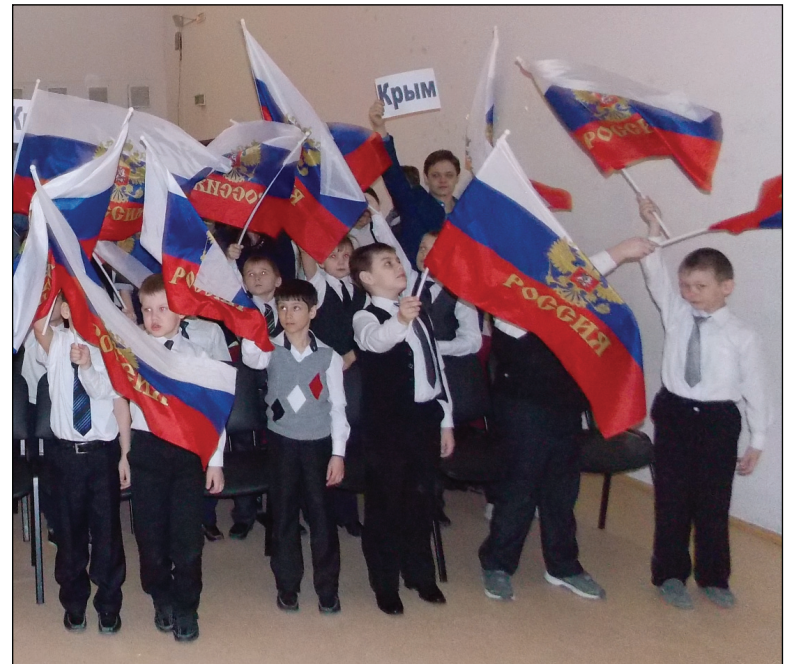
• Активными участниками акции были первоклассники.

«Севастополь, Крым, Россия – мы вместе, мы едины!» – громко продекларировали школьники, завершая мероприятие.