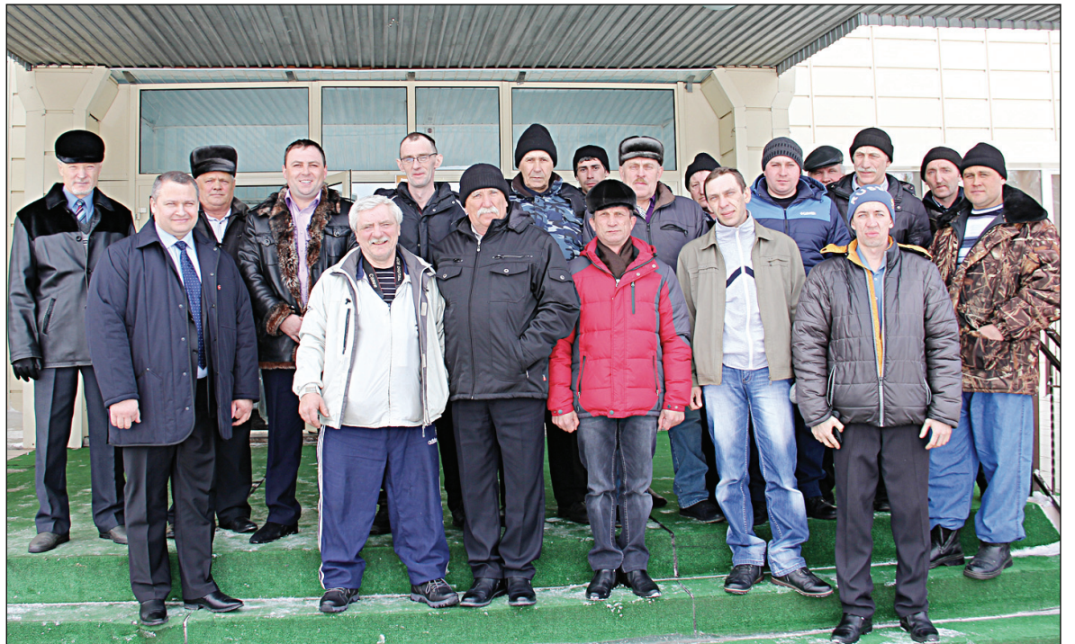
• Коллектив ООО «Аромашевогазсервис».

18 марта, накануне профессионального праздника работников торговли, бытового обслуживания населения и жилищно-коммунального хозяйства, в районном Доме культуры собрались представители этих отраслей. Многие из них пришли сюда для того, чтобы получить поздравления, а передовики производства – благодарственные письма и почётные грамоты.