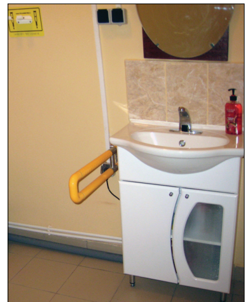
• Санитарная комната оборудована полностью: установлены поручни, приспособление для размещения костылей (на стене), раковина имеет сенсорный смеситель.

Работы по обеспечению доступности социально-значимых объектов для инвалидов, которую предстоит выполнить в районных учреждениях, достаточно много. Во время обсуждения проблемы все руководители единогласно отметили,