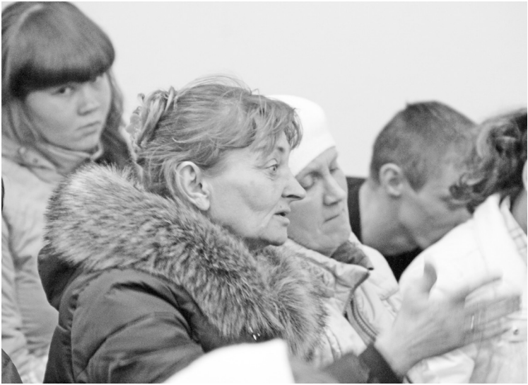
Вопросов у селян всегда много.