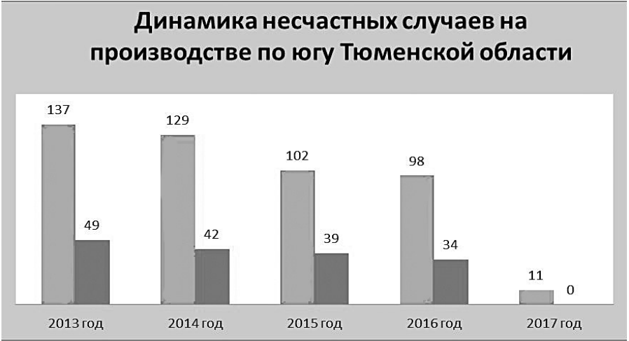
Высокие столбики — это общее число несчастных случаев по годам, низкие — число погибших.

По мнению заместителя руководителя Государственной инспекции труда, главная причина несчастных случаев — допуск людей к работе без обязательного медицинского осмотра, отсутствие обучения и проверки знаний требований охраны труда, а