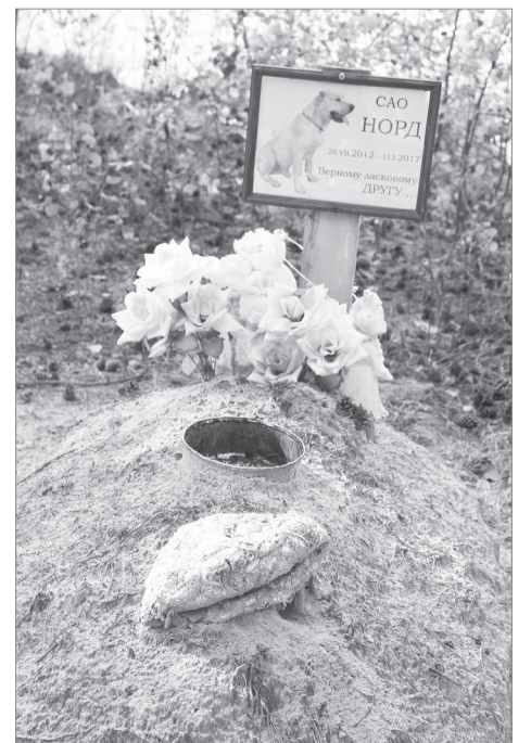
Самый внушительный памятник на собачьем кладбище

Единственное в Москве официальное кладбище для животных располагается в Куркине и внешне мало отличается от человеческого. Разве что холмики меньше. Здесь покоится с миром такса Шерри, спасшая во время пожара семью своего хозяина. Лежат в одной могиле закадычные друзья - дворняга Ризин и ризеншнауцер Джон.