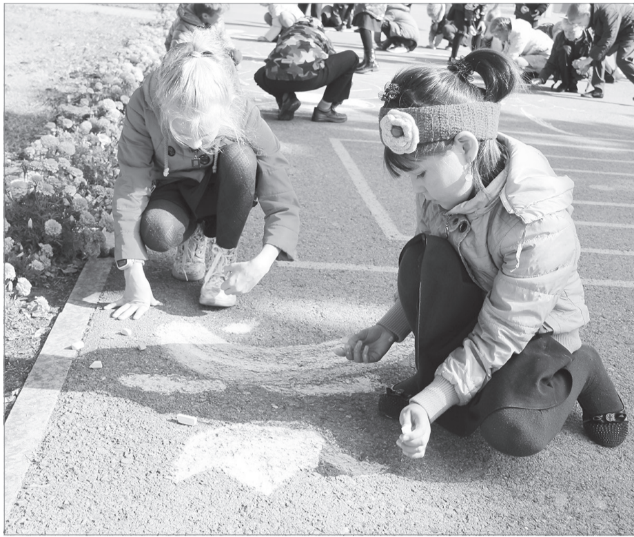
Расцвела на асфальте радуга - как символ мирного неба

Анатолий МЯСНИКОВ Светлана НЕЧАЕВА