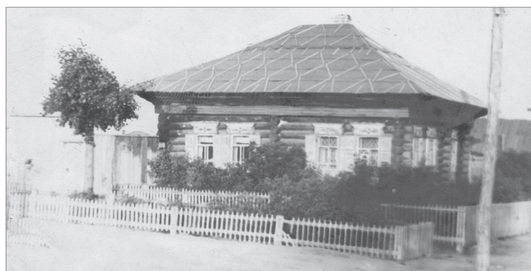
Этот снимок - 1956 года. Теперь возле дома №68 на ул. Первомайской растут пихта и яблони