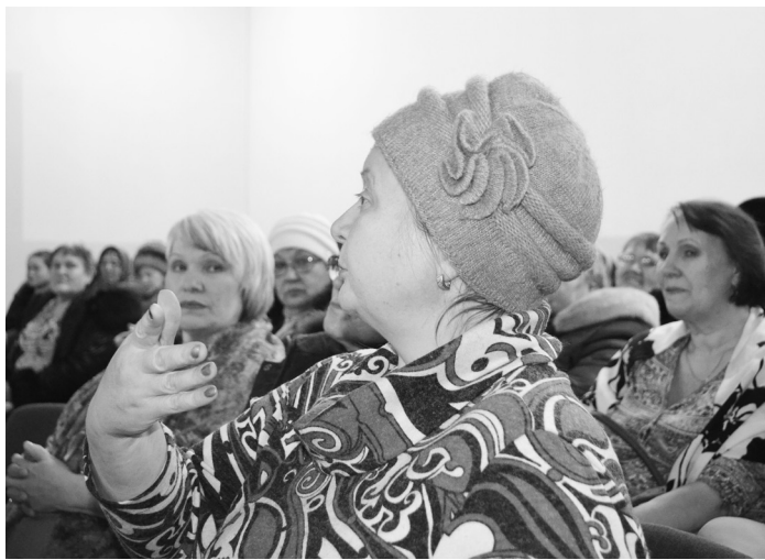
Захватывающее обсуждение наболевшего вопроса.

Велижанцы оказались недовольны стоимостью вывоза мусора. Именно из-за этого многие договоры и не заключают. Где же остаётся мусор, который не вывозят? Конечно, в селе. Было упомянуто несколько мест (в основном, лесные массивы и опушки), где уровень свалок имеет зрительные показате-