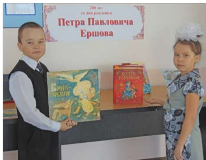
Книжкины именины в Кутарбитке