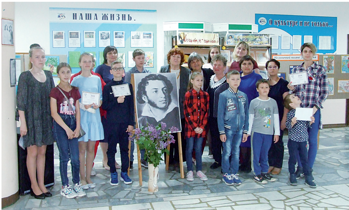
В деревне жизнь кипит. Культурная в том числе

В ритме сельской жизни. Лето, каникулы, время отдыха и отпусков... «Тишь да благодать», – подумает иной. Вот чего уж никак не скажешь про сельского жителя! В деревне жизнь кипит, и у неё особый, свойственный только ей ритм. Сельчане успевают не только обиходить подсобное хозяйство, держать на контроле садово-огородные заботы, заниматься воспитанием приехавших на каникулы внучат. Но и продолжают чествовать односельчан – ровесников Тюменской области и юбиляров, гордятся и верят в будущее молодой смены, широко и радушно празднуют юбилей своего региона, интересно организуют свой отдых, одним словом, находят радость в простом и обыденном. Такой многоликой, наполненной собы-