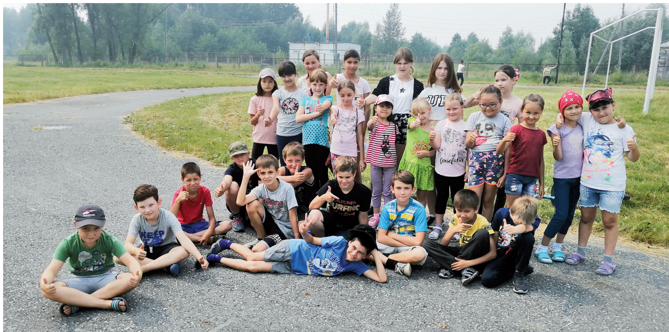
📷 В пришкольном лагере в Надцах скучать некогда

Возвращаясь к теме о контакте поколений, не могу не отметить, как тесно работают в этом плане Прииртышская школа, дом культуры, библиотека, администрация поселения, совет ветеранов. Особенно это заметно в этом году. В летний период очень важно, чтобы дети не болтались на