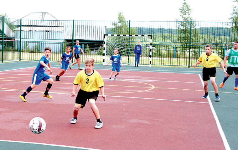
Футболисты будут в восторге!

динально изменились после реконструкции пола, стен, потолка. Но ребят, которые, конечно, не упустили возможности увидеть до 1 сентября знакомые кабинеты физики, химии и математики, были удивлены современным оборудованием, красивыми и немного необычными партами, выполненными из пластика. Каждому захотелось увидеть содержимое предметных мини-лабораторий, которые спрятаны за крышкой ученического стола, полюбоваться суперсовременными интерактивными досками. В распоряжении педагога теперь есть моноблок, ноутбук, принтер и другая техника. Вообще, думаю,