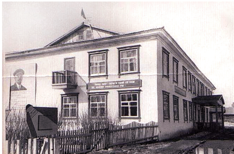
Здание бывшего ДК зверосовхоза