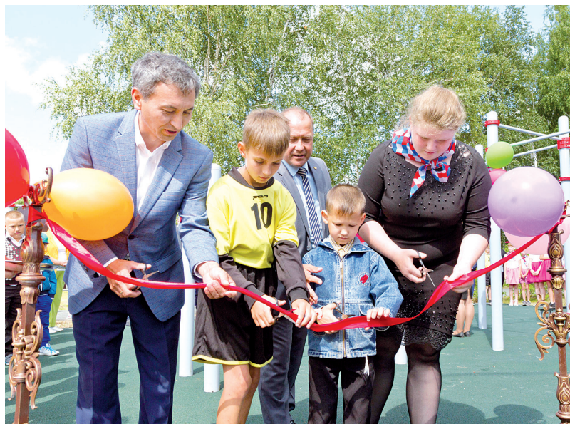
Вперёд, к спортивным вершинам