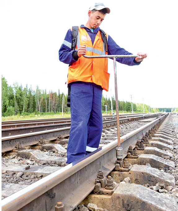
Рельсы, шпалы – привычное место работы путейца