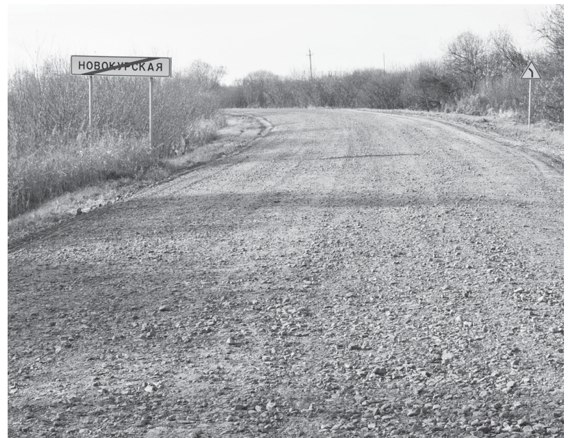
Никуда не делась и старая, проверенная временем, дорога-дублер от Иевлево до Караульняяра