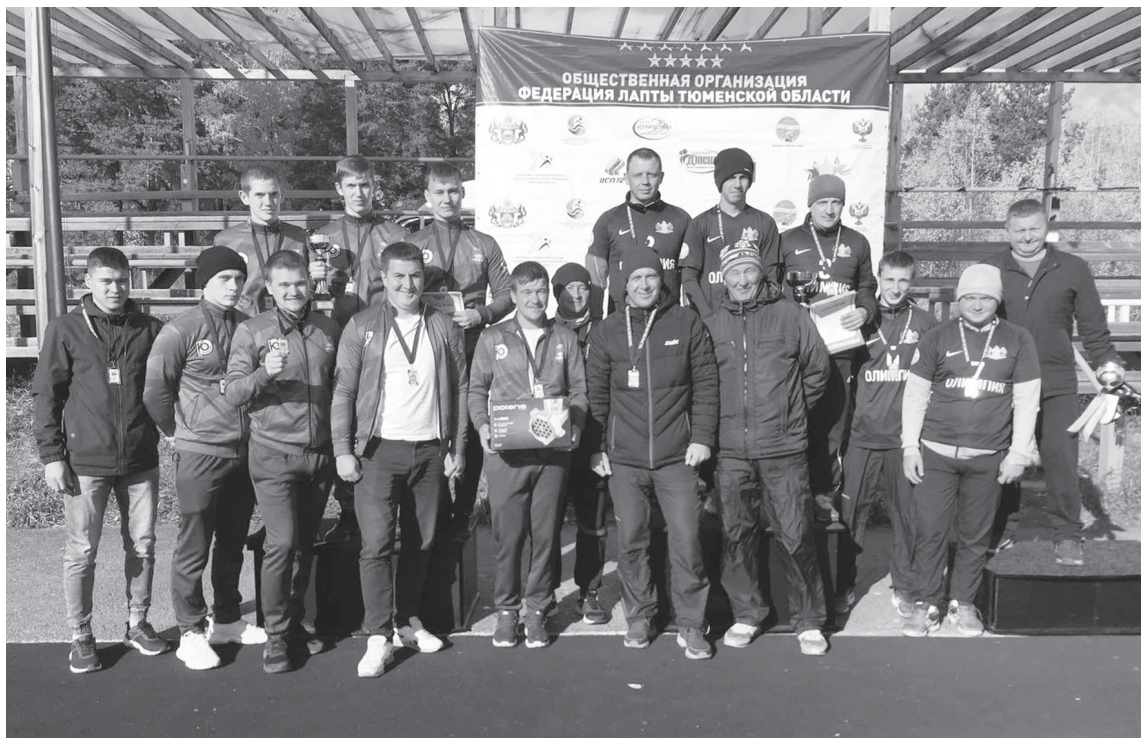
Призеры чемпионата Тюменской области по лапте среди взрослых команд

В следующем году состоится главное спортивное событие для любителей русской игры – кубок России по лапте. Именно Тюменская область станет принимающей стороной столь масштабного состязания.