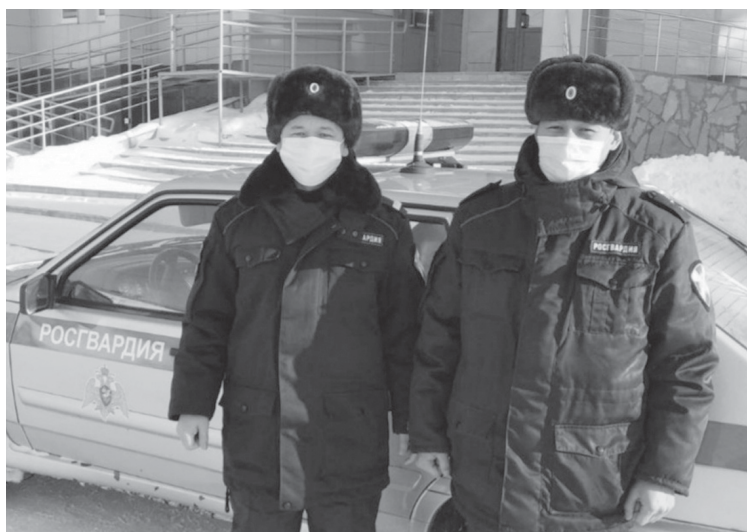
Экипаж вневедомственной охраны Росгвардии

В начале октября управление Росгвардии по Тюменской области отпраздновало сразу два события – пятилетний юбилей со дня своего образования и 30-летие тюменского ОМОНа. Сегодня подразделения войск национальной гвардии дислоцируются в пяти городах и шестнадцать районных центрах региона, в том числе в Ярково. Корреспондент «Ярковских известий» задал вопрос пресс-службе ведомства о предварительных итогах работы за 2021 год.