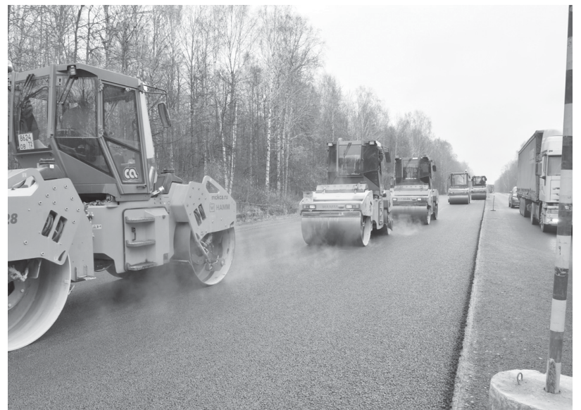
Работы на «федералке» в эти дни ведутся рядом с Сорокинским сельским поселением