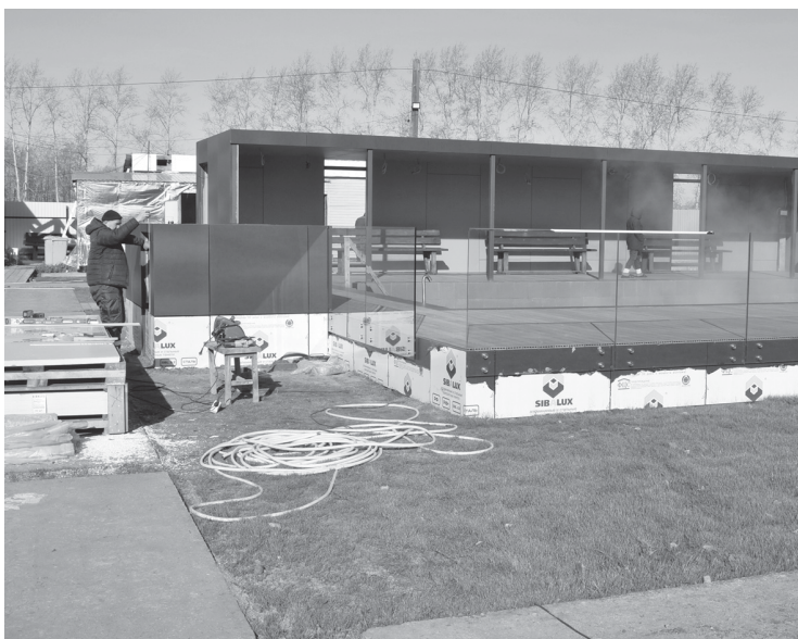
Реконструкция источника в Дубровном стала важным этапом развития этого объекта