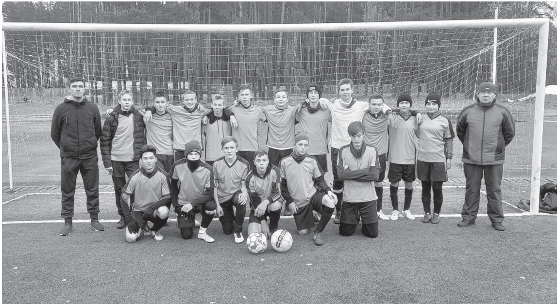
Команда учащихся Яркового района

Команда учащихся Яркового района вышла в финальную часть областной Спартакиады. Зональный турнир состоялся в Нижней Тавде: четыре района разыграли две путевки в финал.