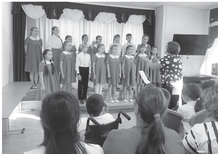
Момент выступления воспитанников ДМШ

По материалам МАУ ДО «Ярковская детская музыкальная школа»