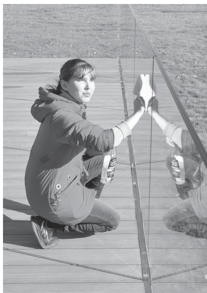
Рядом с бассейном в эти дни наводится лоск

За время своего существования термальный источник в Дубровном успел стать известным не только за пределами Ярковского района, но и всей Тюменской области. Лишь в текущем сезоне – с апреля по сентябрь – здесь побывали проездом жители Свердловской, Челябинской областей, Ханты-Мансийского и Ямало-Ненецкого автономных округов, Татарстана и Башкирии. Такое внимание со стороны автопутешественников обеспечивает целебная минеральная вода, поступающая из недр с полуметра глубиной и имеющая постоянную, без дополнительного подогрева, температуру плюс 43 градуса. Ее состав уникален для наших мест: йод, бром, бор – вот далеко не полный