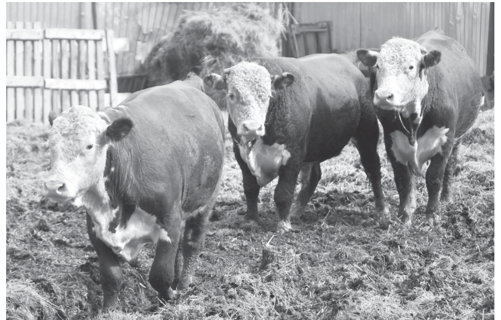
Производство мяса в сельхозпредприятиях Ярковского района с 1975 по 2020 годы

На снимке: Стадо крупного рогатого скота породы «геррефорд» в ООО «Нерда»