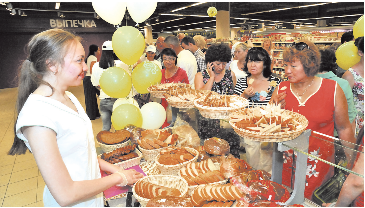
Дегустация хлеба в «Перекрёстке»