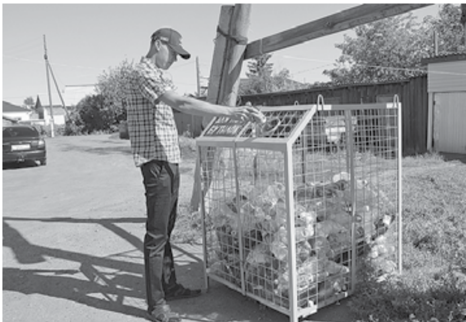
* Сознательные граждане привыкают к раздельному сбору мусора.

Нередко люди спрашивают: «А можно ли поставить подобные баки и для больших бутылок, пятилитровых?». Ведь многие сейчас покупают бутылированную воду в магазинах. Возможно, в дальнейшем мы подумаем о таком варианте.