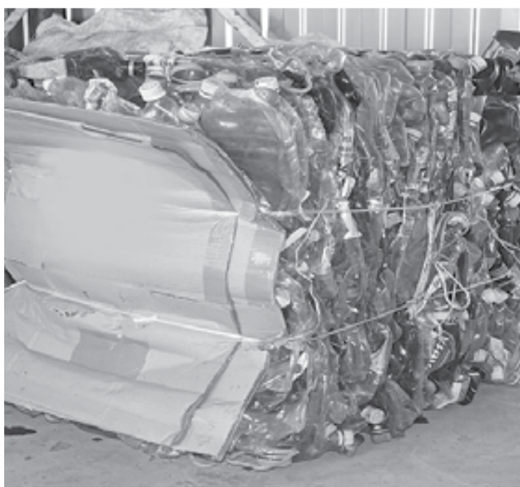
* Вот такая компактная упаковочка получается после пресса!