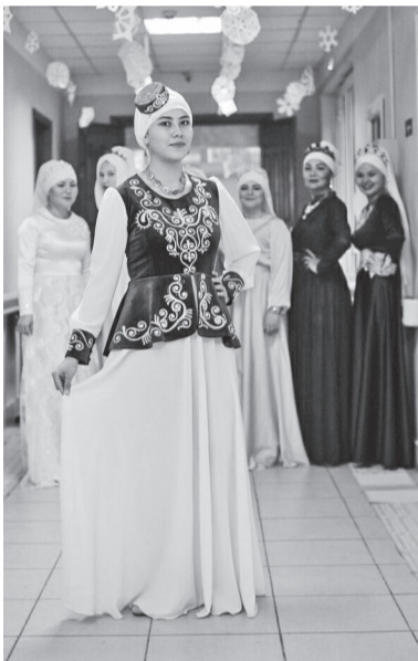
Сарауц – головной убор сибирских татар