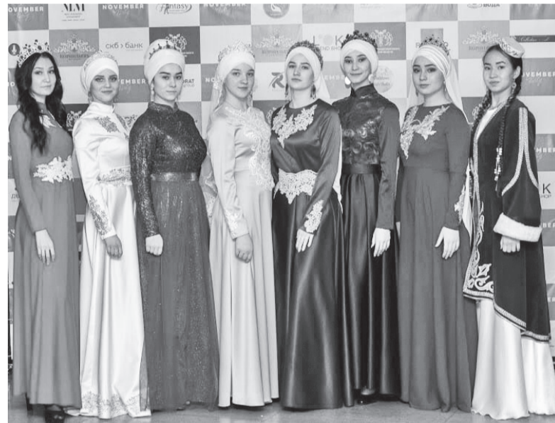
Тобольские красавицы в национальной одежде