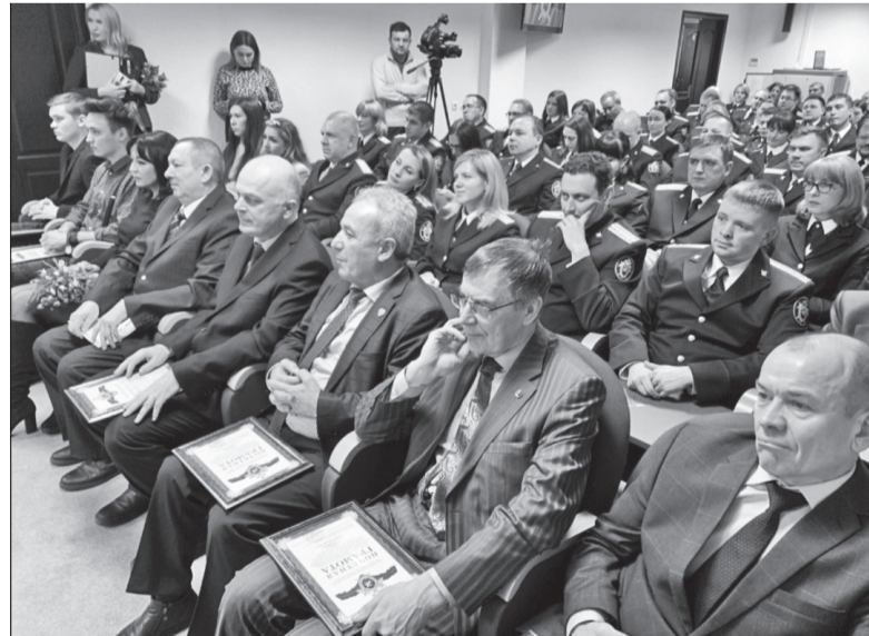
Участники торжественного мероприятия, посвященного годовщине образования СК РФ