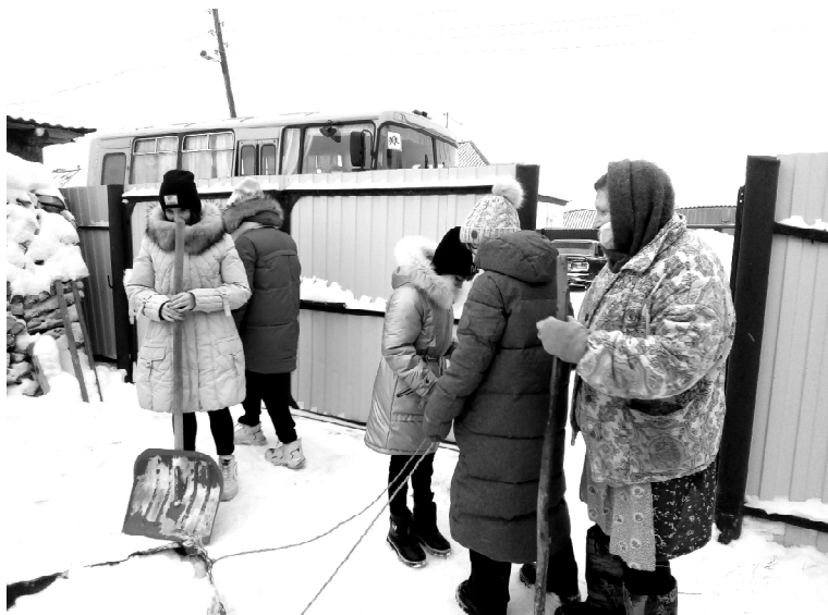
➤ Отряд «Забота» помогает пенсионерам

«Взялся сделать – сделай хорошо», – говорил главный герой повести «Тимур и его команда» советского писателя Аркадия Гайдара. Благодаря этой книге о мальчике и его единомышленниках, тайно помогающих семьям солдат, пожилым и одиноким людям, в Советском Союзе появились первые тимуровцы – добровольцы, готовые бескорыстно оказывать помощь тем, кто в ней нуждается. Доброе дело героев книги подхватили школьники по всей стране, положив начало детскому добровольческому движению.