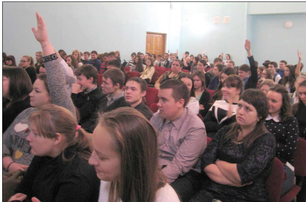
• Учащиеся активно участвовали в дискуссии.