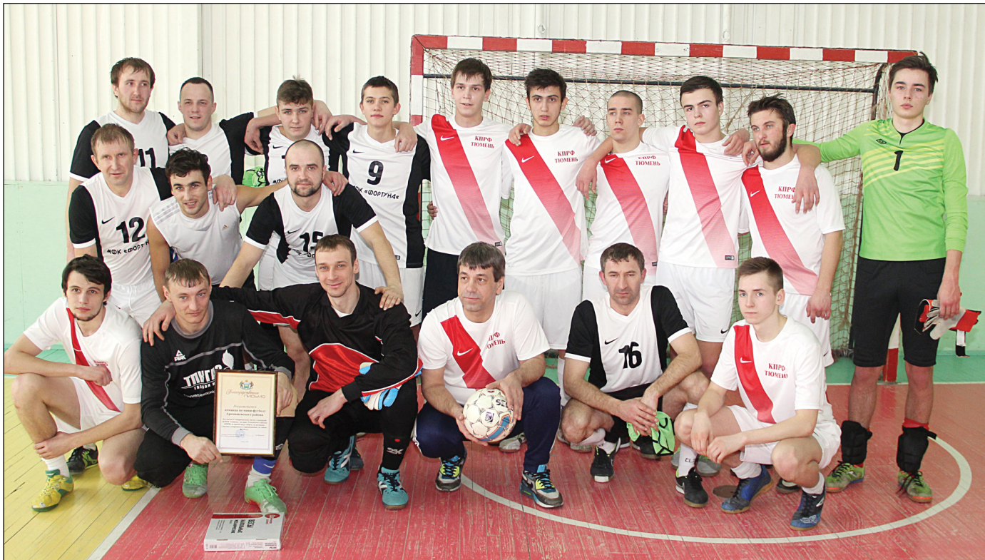
• Аромашевская и тюменская сборные по мини-футболу.

После завершения матча соперники поблагодарили друг друга и сделали общее фото на память.