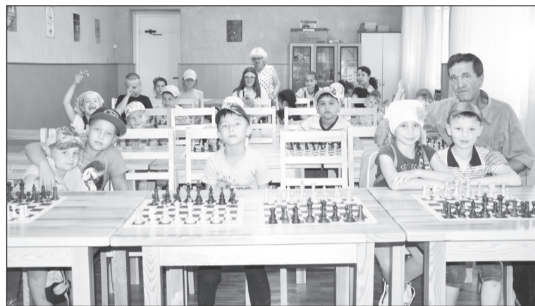
Играя в шахматы, ребята повышают свой интеллект.