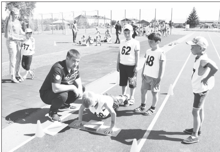
Кто-то на шахматы, кто-то на дзюдо, а мы на ГТО.