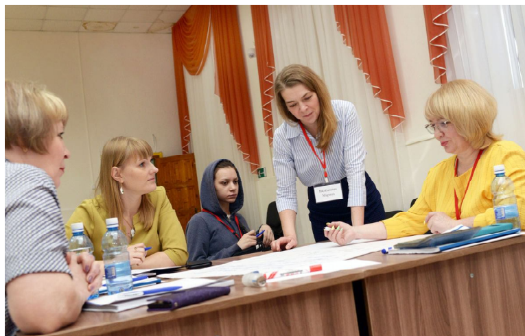
Проходит обучающий тренинг

Центр поддержки предпринимательства «Инвестиционного агентства Тюменской области» запустил образовательный проект - тренинг «Азбука предпринимателя» АО «Корпорация «МСП». Одними из первых в него включились жители Омутинского района.