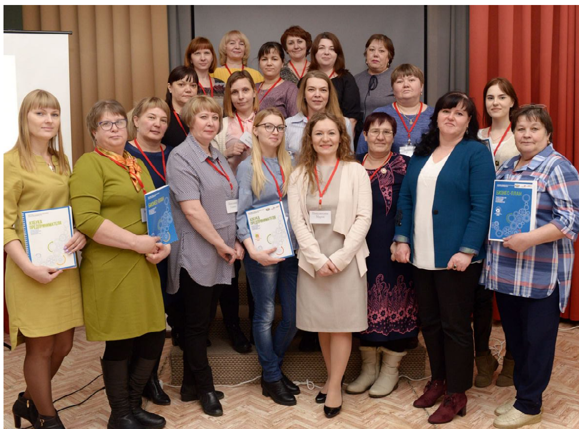
Участникам проекта вручены сертификаты