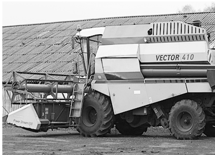
На снимках: (слева) городищенские закрома; (справа) гордость аграриев – комбайн «ВЕКТОР 410»