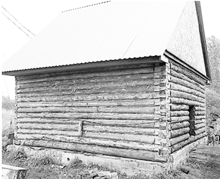
На снимке: (слева) завтрашний офис кладовщика; (справа) сегодняшний сторожевой пост «Комфорт»