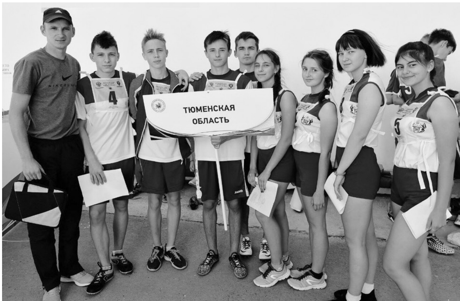
На снимке: Тюменскую область в Анапе представляли сорokinские спортсмены

Учащиеся Сорokinской школы № 1 вошли в десятку лучших сборных России финала «Президентских состязаний»