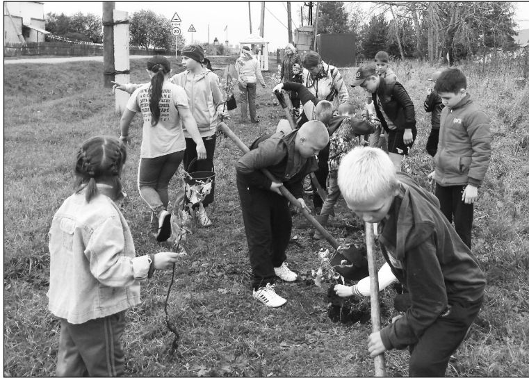
Учащиеся Знаменщиковской школы