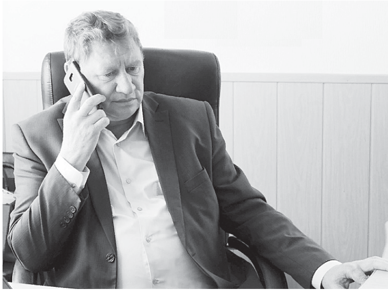
На снимке: глава Сорокинского муниципального района отвечает на вопросы, поступающие на «Горячую линию»

нужна. Но каждая услуга должна быть рентабельна! Пока она находилась в муниципальной собственности, администрация изыскивала возможность и компенсировала убытки. Сегодня собственник сменился, им стал частный предприниматель, который, чтобы развиваться, должен получать за услугу определённый доход.