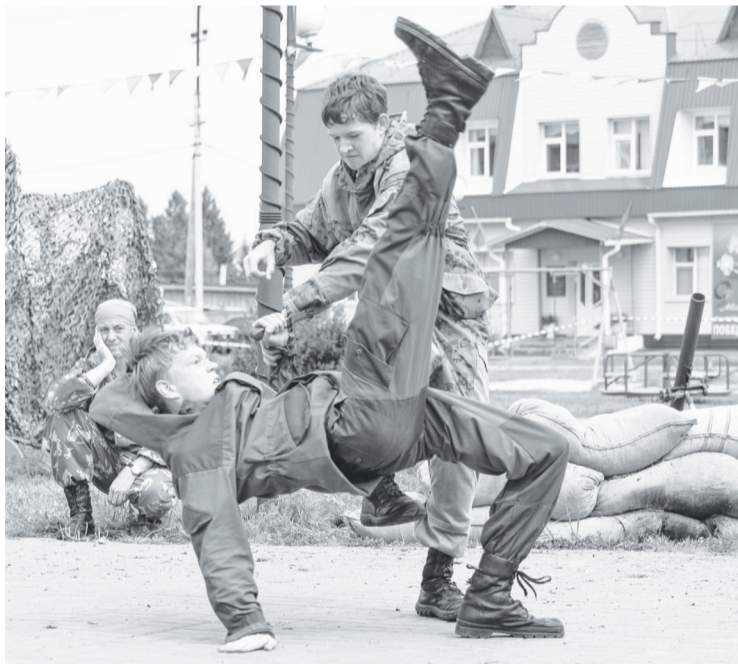
Показательные выступления курсантов «Аванпоста» на районном дне ВДВ. 2015 год.