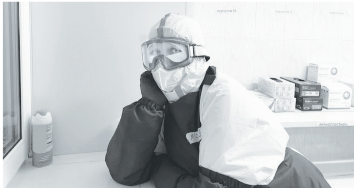
Сотрудникам многогоспиталя передышки в работе необходимы.

Людмила ИВЛЕВА.