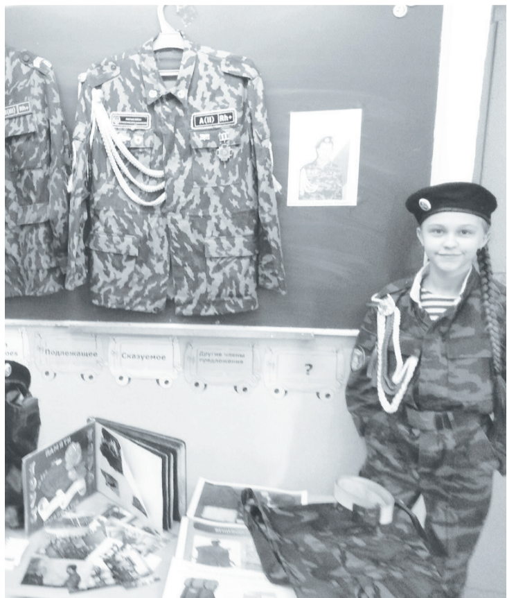
Арина Александровна знает о содержимом армейского чемоданчика.

Дети и подростки активно участвуют в акциях: «Память», «Тепло родного дома», «Подарок папе» и других. О том, что такое патриотизм и как стать достойным защитником Отечества, порассуждали ученики Пятковской и Суерской школ.