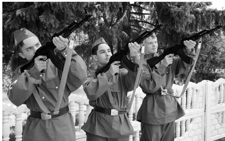
Оружейный салют в День памяти и скорби