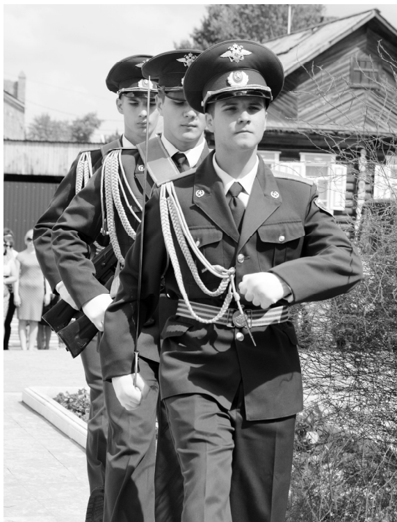
Почетный караул несет «Вахту Памяти»

В 12.00 в районном Доме культуры состоялась презентация очередной книги о воинах-земляках, выпущенной районным советом ветеранов. Второй сборник цикла называется «Дети войны». В него вошли материалы о фронтовиках и