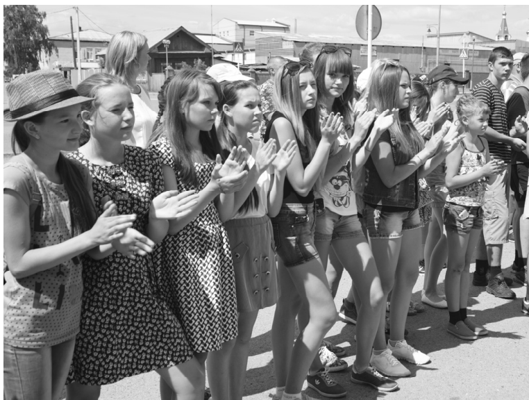
Молодое поколение помнит подвиг героев войны

22 июня у памятника воинам-землякам прошел митинг, посвященный Дню памяти и скорби. Трагическая дата в истории нашей страны - напоминание о подвиге и доблести советского народа в годы Великой Отечественной войны. Люди разных поколений пришли, чтобы отдать дань уважения мужеству и стойкости участников ВОВ, тружеников тыла, почтить минутой молчания павших героев.