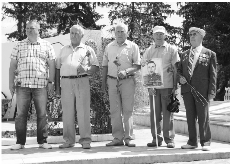
Ветераны и инициаторы автопробега «Вахта Памяти»