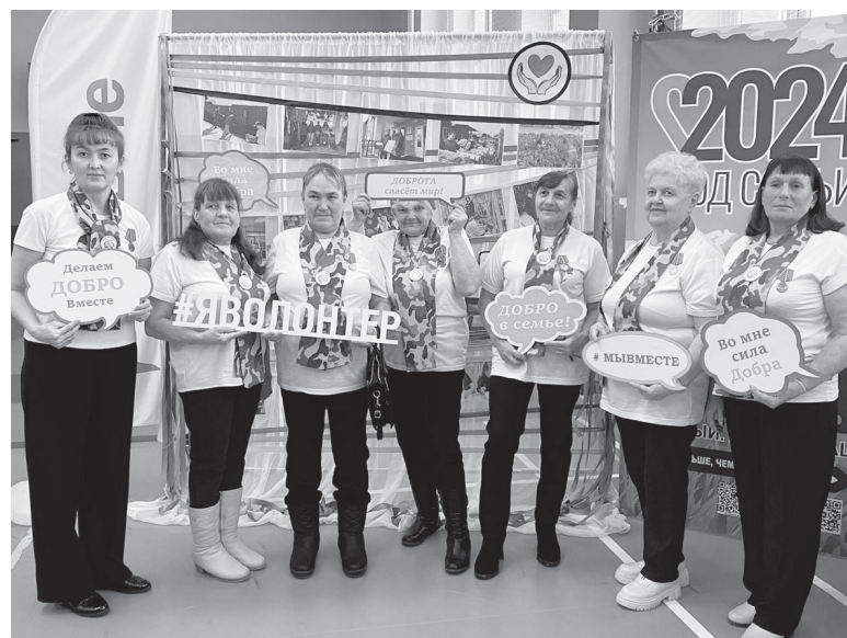
Волонтеры из Дубровного

О «серебряных» волонтерах – особые слова. Именно ветераны стали самыми активны-