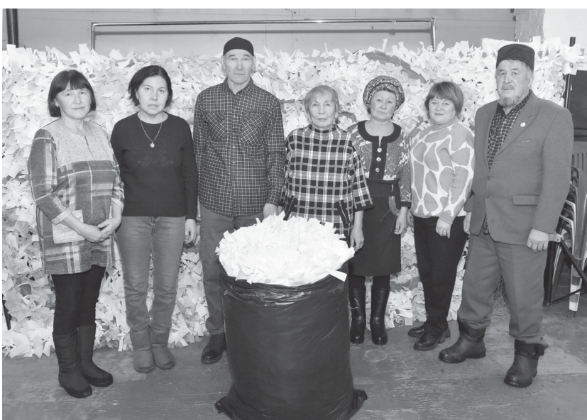
Волонтеры из Чечкино

«Ярковские известия» неоднократно рассказывали о людях, которые готовят маскировочные сети для СВО. На этот раз за такую работу жителей Чечкино.