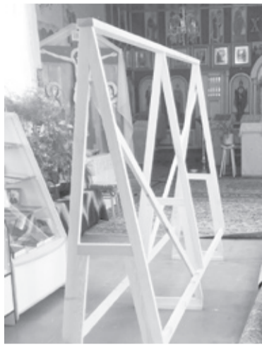
|| Рамка для плетения маскировочных сетей

- У нас большая радость! Благодаря мастеру по дереву Сергею Калгашкину и предпринимателю Эдуарду Шорохову у нас появилась рамка для плетения маскировочных сетей, спрос на которые очень вырос. По благословению священнослужителя рамку поставили в наш храм Святого