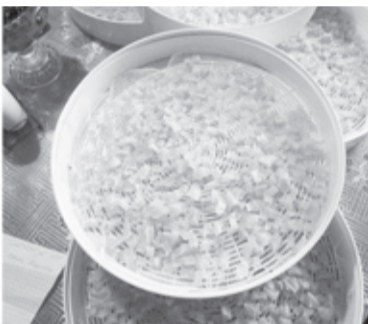
Сушёные овощи для суповых наборов.

апостола и евангелиста Иоанна Богослова, где мы и планируем начать плести маскировочные сети в ближайшее вре-