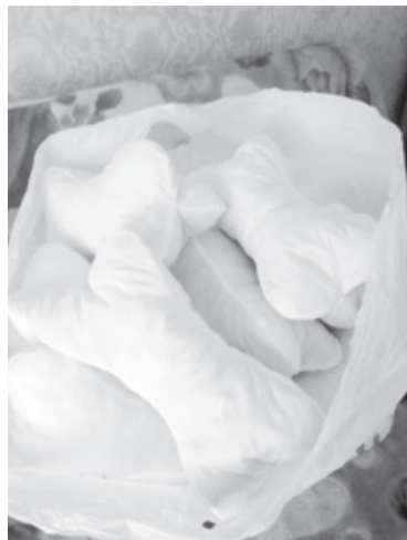
|| Подушки "косточка"