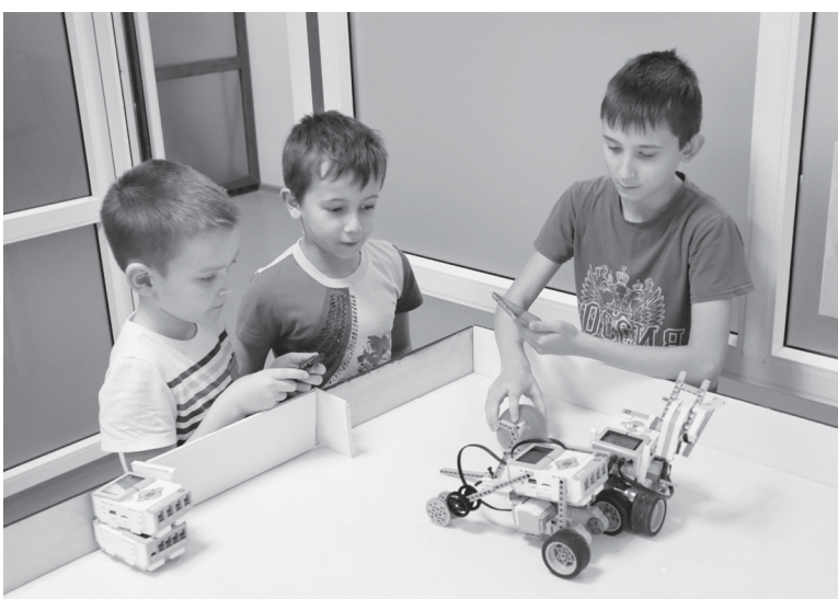
На сражение вышли «автоботы»