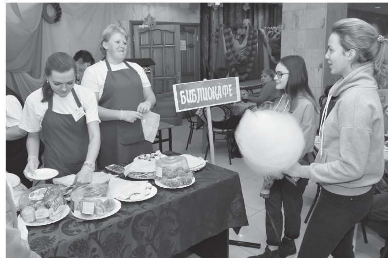
ПИСЬМО В ГАЗЕТУ