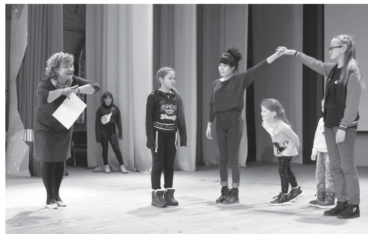
Всем пришедшим на «Ночь искусств» нашлось занятие по душе