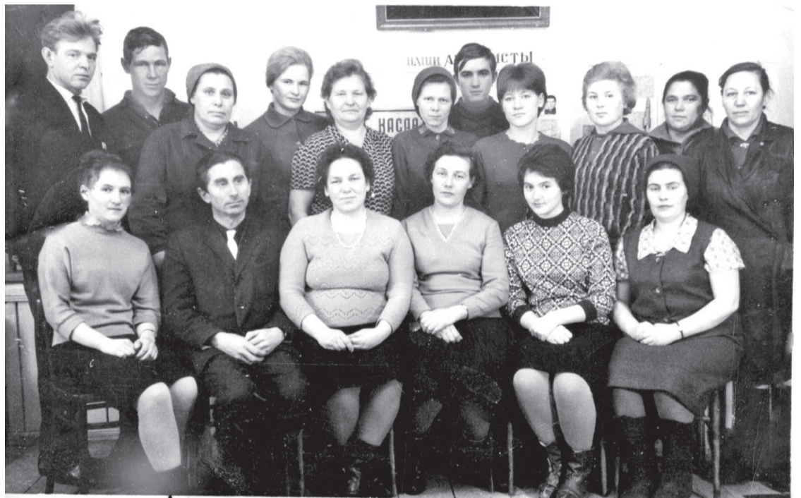
• Это первый коллектив редакции газеты «Советское Зауралье» и типографии (1960-е годы). К сожалению, мы не знаем тех, кто запечатлён на этом снимке. Надеемся, что вы, уважаемые читатели, поможете нам в этом.

Сегодня вы держите в руках десятилетиями номер газеты «Заводоуковские вести». Этот отсчёт идёт с 11 апреля 1965 года, когда вышел в свет первый номер газеты «Советское Зауралье».