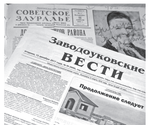
• Между этими номерами газеты чуть больше полувека.