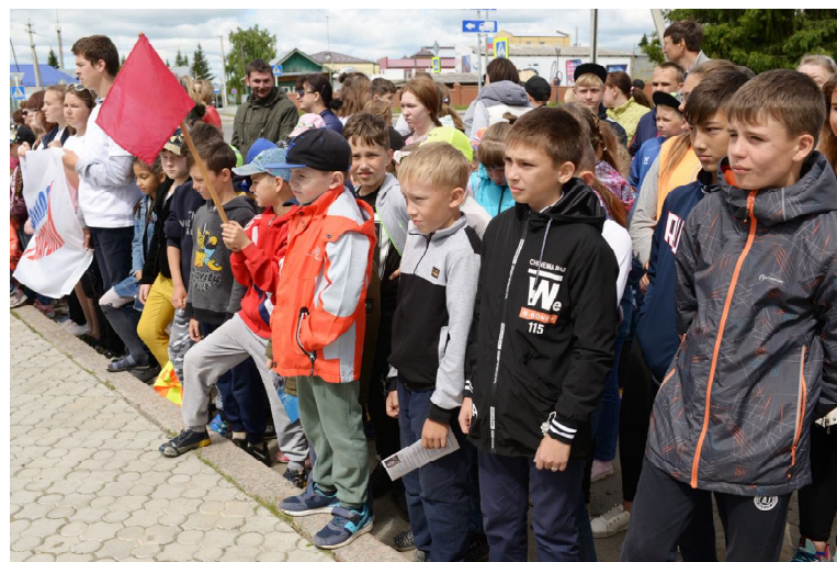
Молодое поколение чтит подвиг прадедов