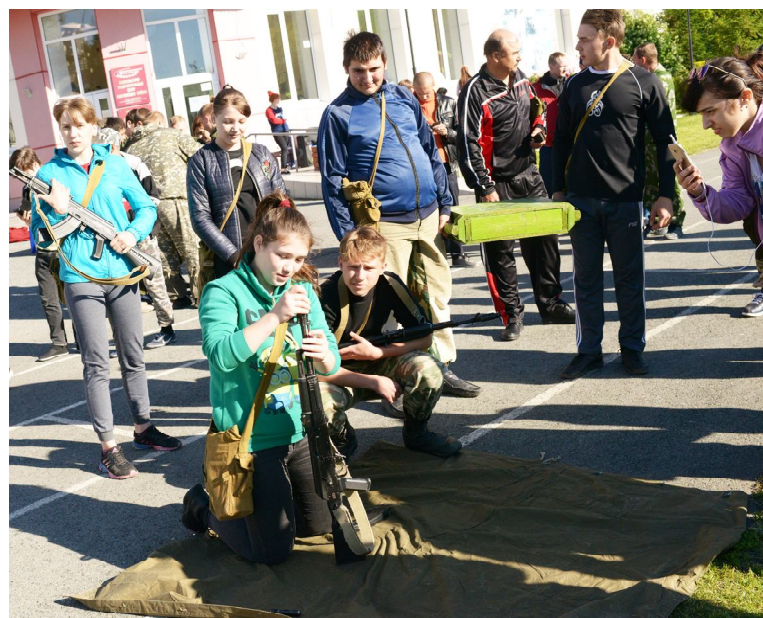
Один из этапов Зарницы: сборка и разборка оружия по силам и девчонкам