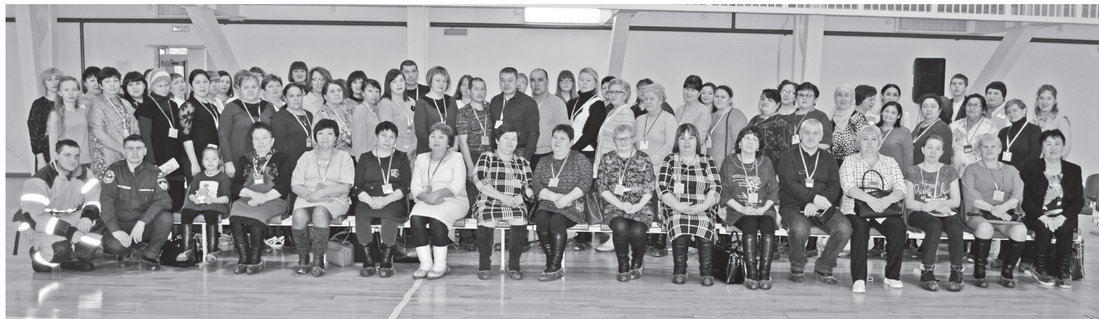
Участники форума замещающих родителей