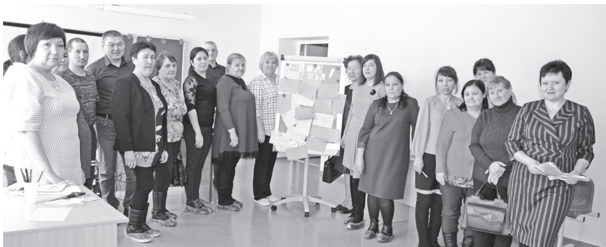
Участники тренинга «Все начинается с семьи»

СЧАСТЬЕ – это просто уверенность в том, что ты нужен!