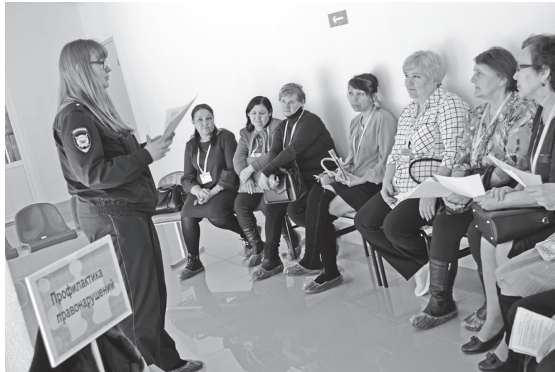
Идет консультация по профилактике правонарушений

Форум направлен на раскрытие и использование ресурса замещающих родителей в воспитании детей, оставшихся без попечения родителей, повышение гражданской активности и ответственности населения за судьбу детей-сирот.