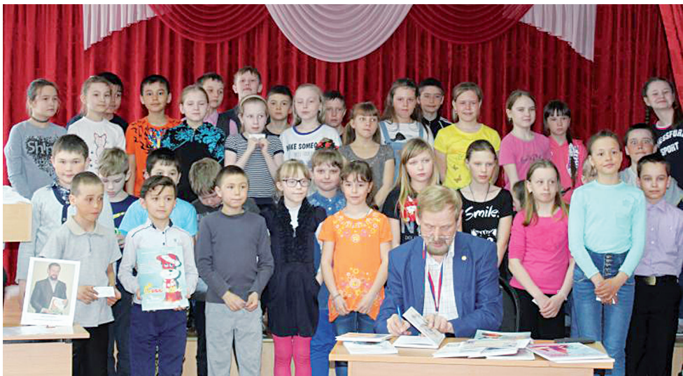
Подарком для Приуртышских книголюбов стали книги, подписанные автором

21.25 «Титаник гавань в Огре» [12] . 21.45 Военный фильм «Утомленные солнцем-2. Цитадель» [16] . 01.10 Концертная программа «В пылающий адрес войны...» 02.20 «Рыбацкими маршрутами Югры» [12] .